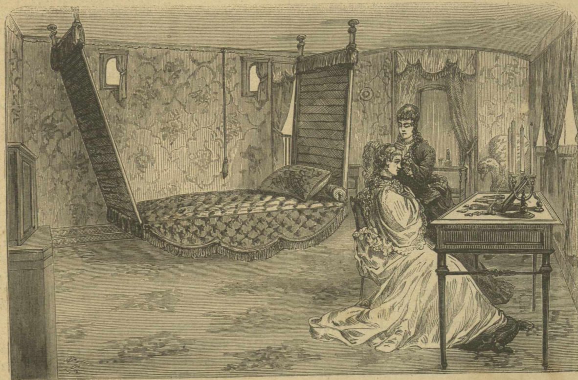
Ἀριθ. 1. Κοιτῶν.

ἤθελον μᾶς ὀθήσει εἰς τὰ ὀπίσω οἱ βόρειοι ἄνεμοι. νύξ διήρκεσε μόνον 125 ἡμέρας, ἀλλ' ἄνευ τῶν φοβερῶν συμπίεσεων καὶ καταπίεσεων τοῦ παγετοῦ. Τὸ