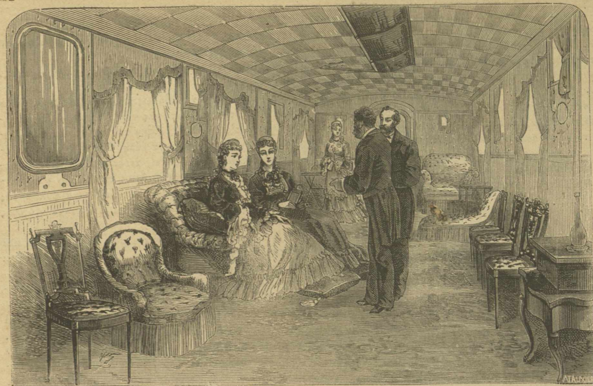
Ἀριθ. 2. Αἴθουσα ἐποδοχῆς.

του θετικὴν ἀπάντησιν. Ἐν ᾧ δὲ ἠσυχολοῦμεθα νὰ λύσωμεν τὰς ἀπορίας ἡμῶν, ἐπῆλθεν ἡ πολικὴ νύξ,