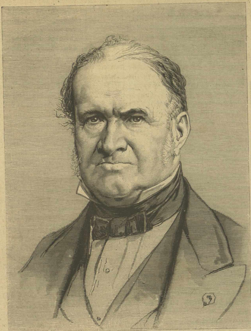
ΗΛΙΑΣ ΒΩΜΩΝ ὁ διάσημος γεωλόγος.