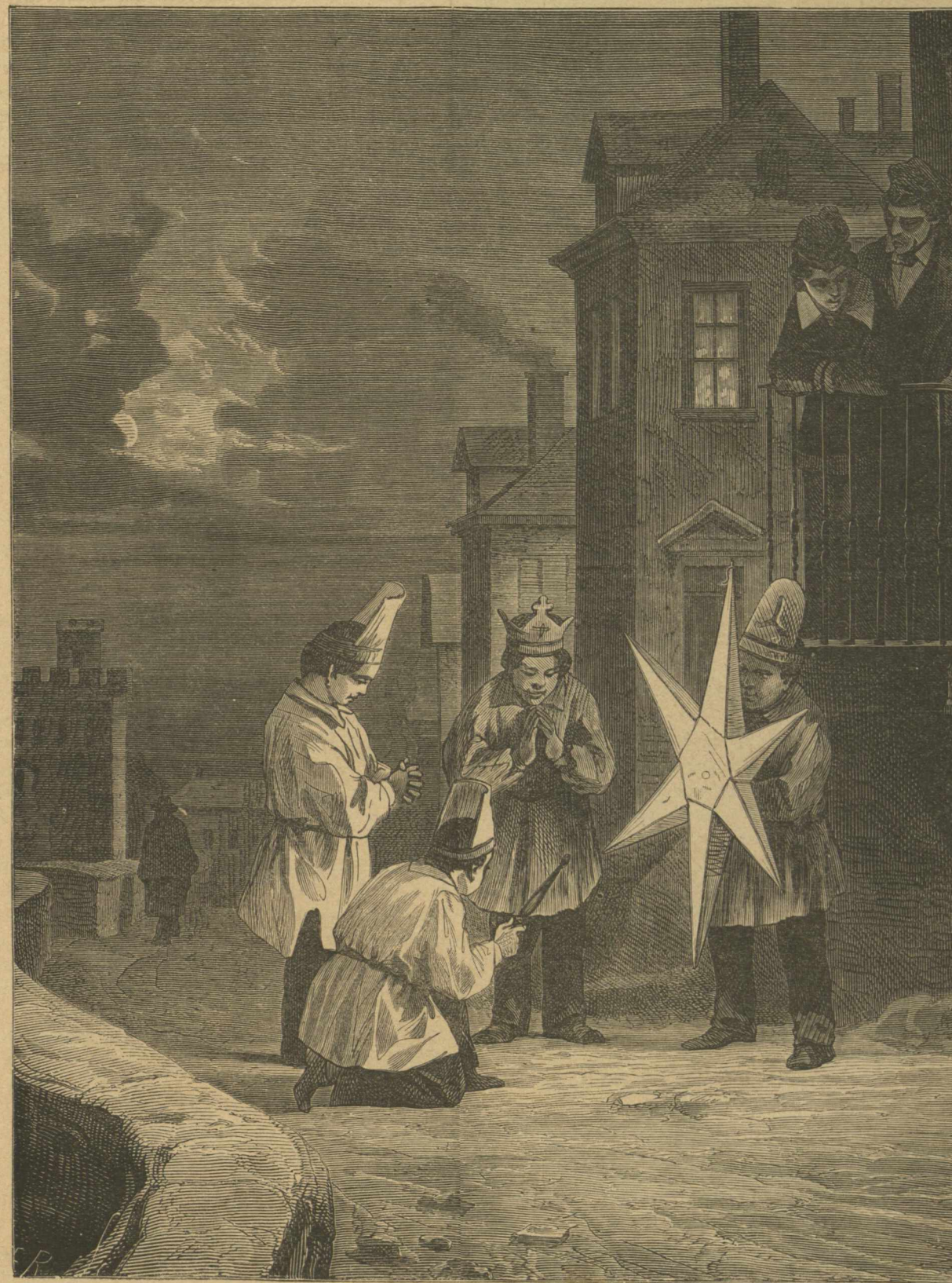
Παῖδες ἄδορτες τὰ Χριστούγεννα ἐν Νορβηγίᾳ.

Ἐσπέραν τινὰ μετὰ τὸ δεῖπνον, εἶπεν ὁ Ἀνδρέας εἰς τὴν γυναῖκά του