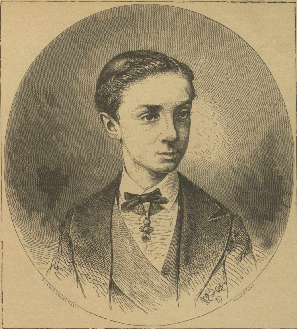
Ἀλφόνσος ΙΒ' βασιλεὺς τῆς Ἰσπανίας.