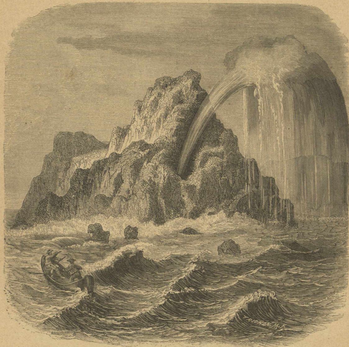
Βουφεδάρων, φυσικὸν ἀναβρυτήριον ἐν Μεξικῷ.