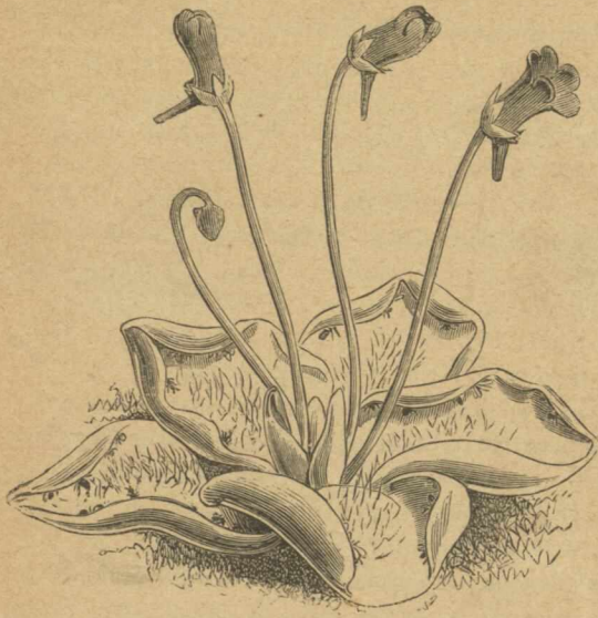
1. Λιπαρόφυλλον τὸ κοινὸν ( Pinguicula vulgaris )