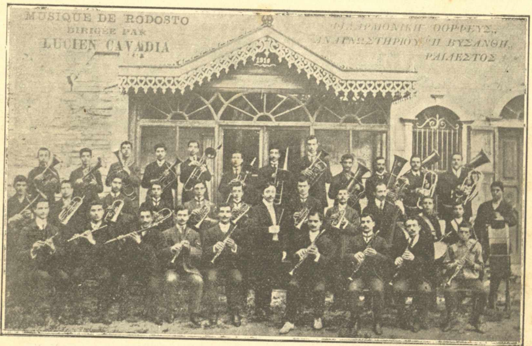
Η ΦΙΛΑΡΜΟΝΙΚΗ "Ο ΟΡΦΕΥΣ,, ΤΗΣ ΡΑΙΔΕΣΤΟΥ

Ἐν Ἑλλάδι. — Ἐγκαίρως εἴχομεν γράφει, ὅτι ἡ Διεύθυνσις τοῦ Ὑδείου Ἀθηνῶν εἶχε προκηρύξει πέρυσιν ἡ Ἀβερῶφειον μουσικὸν διαγωνισμὸν πρὸς μελοποίησιν 20 μαθητικῶν, φοιτητικῶν καὶ στρατιωτικῶν ᾄσμάτων, πρὸς βράβευσιν ἐκάστου τῶν ὁποίων διέθετον 125 δραχμ. Ἡ κρίσις θὰ ἐγίνετο κατὰ τοὺς ὄρους τοῦ διαγωνισμοῦ περὶ τὰ τέλη τοῦ λήξαντος ἔτους 1911, ἀλλ' αὕτη, δὲν γινώριζομεν διατί, ἐγένετο μετὰ παρέλευσιν πέντε (ἀρ. 5)