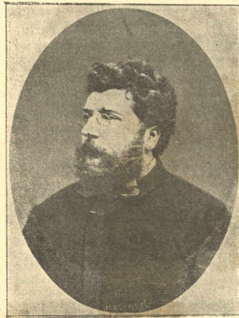
ΓΕΩΡΓΙΟΣ ΜΠΙΖΕ — GEORGES BIZET