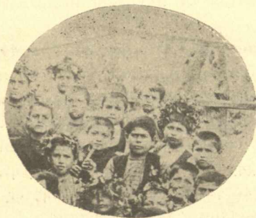
Ὁμίλος ἐστεφανωμένων αὐλητῶν παιδῶν ἐν Ὁρτάκιοι.

συνορευούσῃ τῇ Βιθυνίᾳ Φρυγίᾳ . τῇ κατ' ἐξοχὴν πατριδί τῶν φρυγικῶν αὐλῶν τῆς ἀρχαιότητος. Αἱ πρὸς τιμὴν τῆς Κυβέλης ἐορταὶ ἐκαλοῦντο Μεγαλήσια , διότι ἐτελοῦντο πρὸς τιμὴν τῆς Μεγάλης Θεᾶς , οἱ ἱερεῖς δὲ Γάλλοι , ἐκ τοῦ Γάλλου ποταμοῦ τῆς Φρυγίας. Κατὰ τὴν αὐτὴν Μυθολογίαν ἡ πυεκη καὶ ἡ ἐλάτη ἦσαν τὰ εἰς τὴν Θεᾶν ἀφιερωμένα ἱερὰ δένδρα, ἢ μὲν, διότι ἐκ τοῦ ξύλου τούτου οἱ ἱερεῖς αὐτῆς κατεσκευάζον τοὺς ιεροὺς αὐλοὺς , ἢ δὲ πρὸς ἀνάμνησιν τοῦ Ἄττιος, ὃν αὐτὴ εἰς τὸ δένδρον τοῦτο μετεμόρφωσεν. Ὁ Ἄττιος, νέος καὶ ὠραῖος τῆς Φρυγίας ποιμὴν, ἦτο ἱερεὺς τῆς Κυβέλης, ὃν ἡ Θεὰ αὕτη ἠγάπησεν ἔμμανως. Ἄλλ' οὕτως ἀντ' αὐτῆς προετίμησε τὴν νύμφην Σαγγαρίδαν , θυγατέρα τοῦ καὶ διὰ τῆς Βιθυνίας