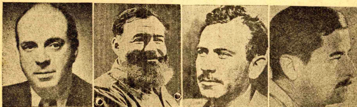
John de Passos

ΤΖΩΝ ΝΤΟΣ ΠΑΣΣΟΣ. Γεννήθη- κε στο Σικάγο το 1896. Γιός ενός δικηγόρου και διεγγονος ενός πα- πουστή, πορτογαλλικής καταγωγής. Έκαμε ταξίδια στο Μεξικό και στην Ευρώπη με τους γονείς του. Πήγε στο Πανεπιστήμιο του Χάρβαρτ. Α- πό κει βγήκε το 1916 και πήγε στην Ισπανία για να σπουδάσει αρχιτε- χτονική. Το 1917 βρίσκεται στο Πα- ρίσι. Μεσολάβησε ο πόλεμος και ξαναπήγε στην Ισπανία, Εγγύς Α- νατολή και Μεξικό, αυτή τη φορά σα δημοσιογράφος. Από την αρχή του β' παγκ. πολέμου περιόδευσε στις Η. Π. κι έγραψε τον «Απολογισμό ενός έθνους».