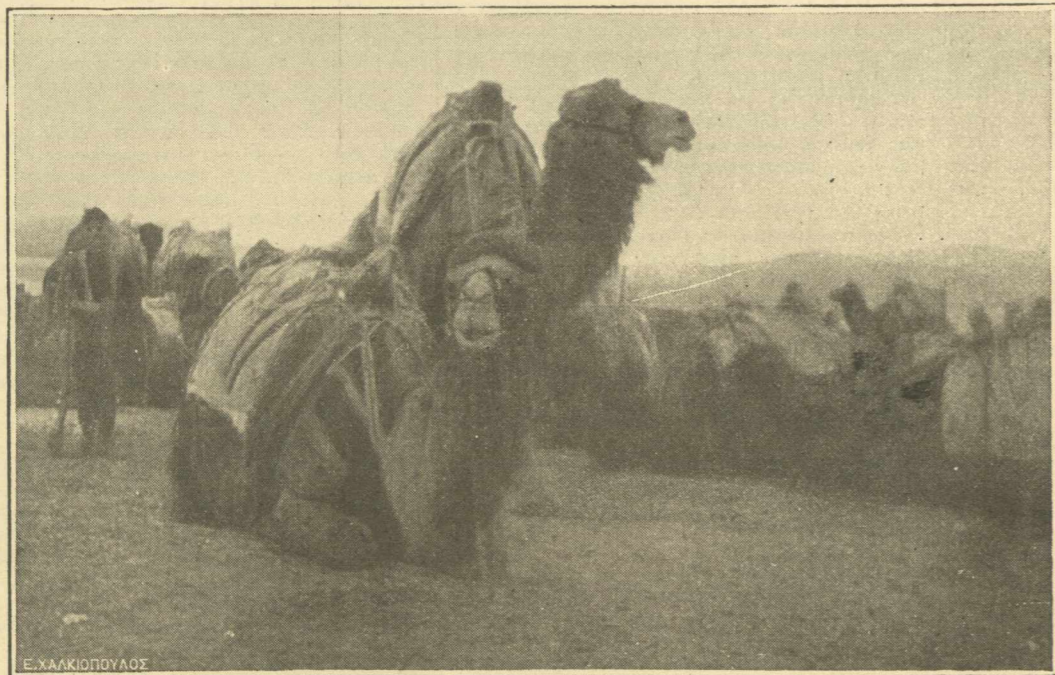
ΜΕΤΟΠΙΣΘΕΝ.—Ὅλοκληρα συντάγματα ἀπὸ γκαμήλες ἀνίχουν εἰς τὴν δύναμιν τῆς ἀρτίως ὀργανωμένης ὑπηρεσίας τῶν μετόπισθεν.