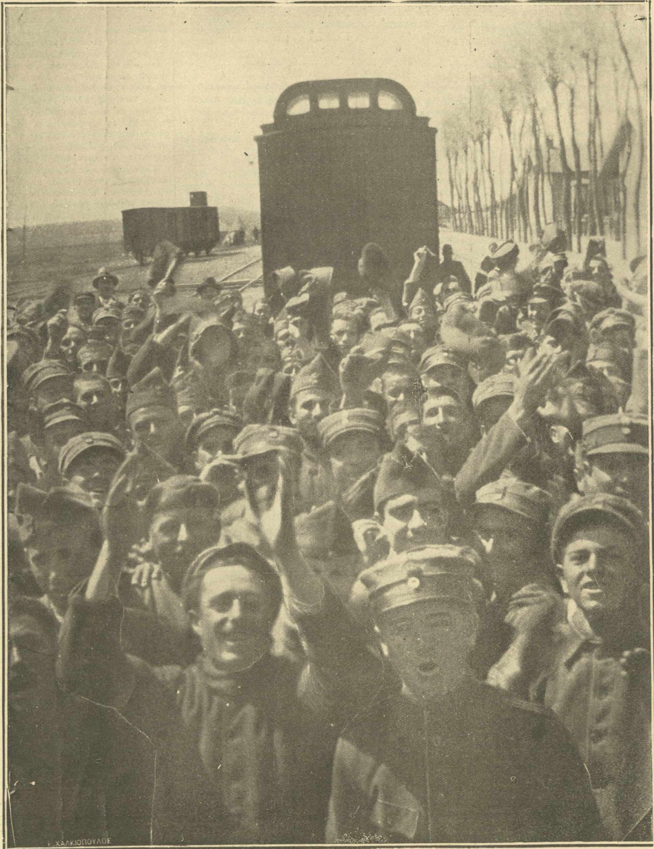
ΠΡΟΣ ΤΗΝ ΝΙΚΗΝ.—Τὸ τραίνο φεύγει διὰ τὸ μέτωπον. Οἱ ἀπομένοντες γενναῖοι προπέμπουν ἐνθουσιωδῶς τοὺς ἀναχωροῦντας οἵτινες περιμένουν καὶ αὐτοὶ ἐναγωνίως νὰ ὀδεύσουν τὴν ὁδὸν τῆς Νίκης καὶ τῆς Δόξης.