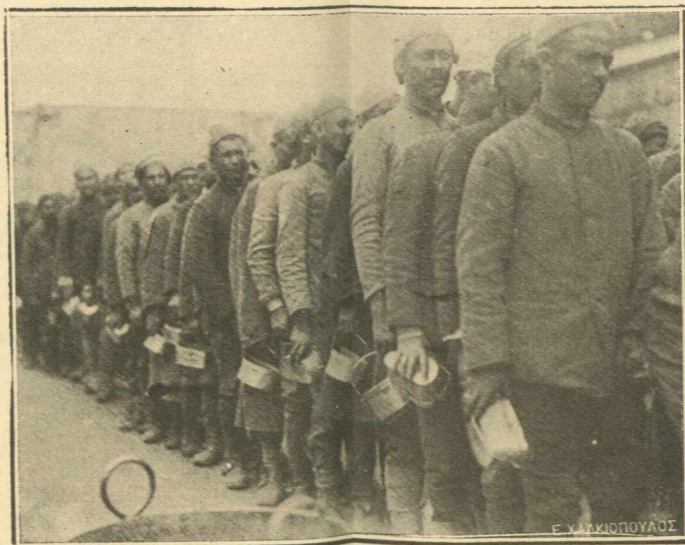
ΣΤΡΑΤΟΠΕΔΩΝ ΑΙΧΜΑΛΩΤΩΝ.—Καθαροί, χαλινωμένοι, ἀπολαμβάνουν τὰ ἀγαθὰ τῆς αἰχμαλωσίας τῶν ἐνθουμούμενοι μὲ φρίκην τὴν Τουρκικὴν...πειθαρχίαν καὶ χαλοπέρασι, οἱ στρατιῶται τοῦ Κεμάλ.