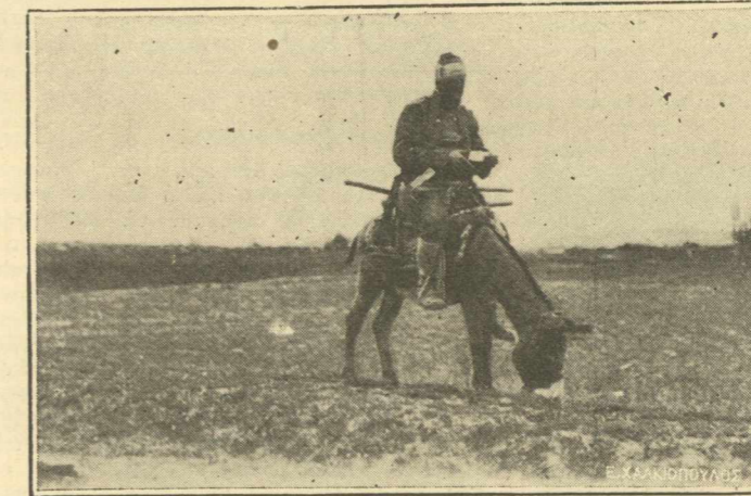
ΚΑΤΑΣΚΟΠΟΙ.—Ἀδύνατον νὰ γλυτώσουν ἀπὸ τὰ λαγωνικά τοῦ στρατοῦ μας οἱ διάφοροι κατάσκοποι τοῦ Κεμάλ οἱ ὁποῖοι προσποιούμενοι τοὺς χωρικοὺς ἢ τοὺς ἐμπόρους προσπαθοῦν νὰ παρακολουθήσουν τὸν Στρατὸν μας. Ὁ ἐμφανιζόμενος εἰς τὴν εἰκόνα μας συνελήφθη καὶ ἐδικάσθη ὑπὸ τοῦ στρατοδικείου τῆς...μεραρχίας τὴν ὁποίαν προσεπάθησε νὰ παρακολουθήσῃ.