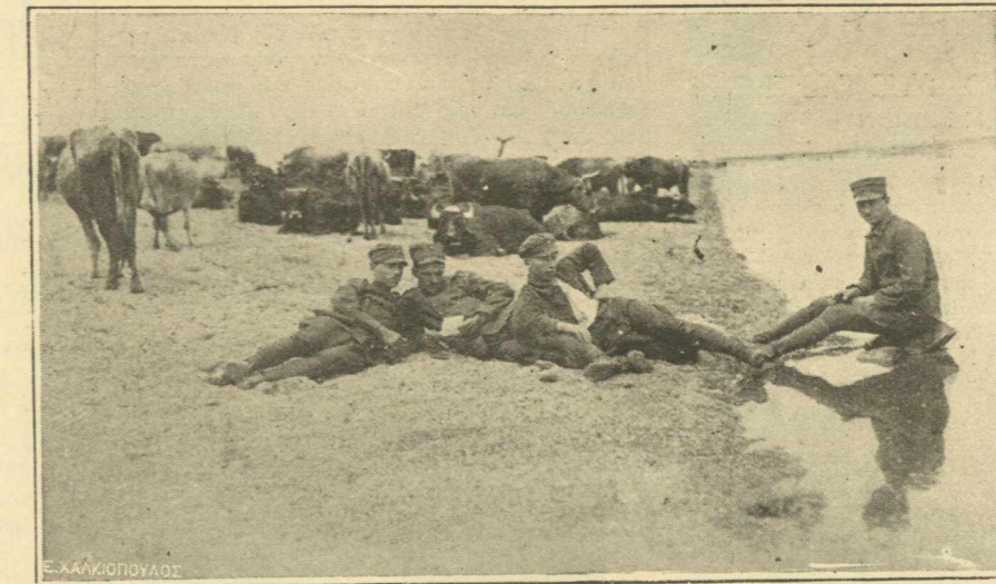
ΑΠΟ ΤΟ ΜΕΤΩΠΟΝ.—Ἀνάπαυσις ἀνδρῶν καὶ ζώων εἰς τὴν ἀχύμαντον ὄχθην τῆς...λίμνης.