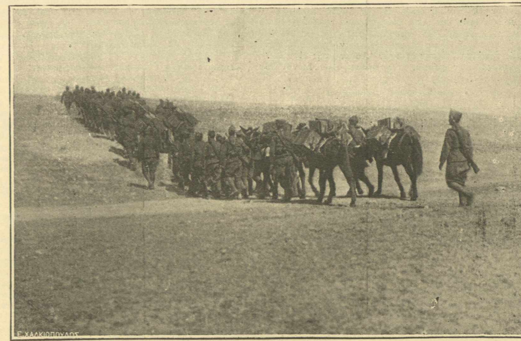
ΠΡΟΣ ΤΗΝ ΝΙΚΗΝ.—Ἀπὸ τῆς ἡμέρας τῆς ἀναλήψεως τῆς ἀρχιστρατηγίας ὑπὸ τοῦ διαφνοστεφοῦς Στρατηλάτου ἤρχισε ζοηρὰ κίνησις εἰς τὰς γραμμάς τοῦ μετώπου. Μετακινήσεις καὶ ἀλλαγαι θέσεων ἐτεωρήθησαν ἀπαραίτητοι διὰ τὴν προετοιμασίαν τῆς Νίκης, συμφώνως πρὸς τὸ νέον σχέδιον ἐπιθέσεως τὸ ὁποῖον ἐξεπόνησεν ὁ θρυλικὸς Βασιλεὺς ἐν συνεργασίᾳ πρὸς τὸ ἐνδοξον ἐπιτελεῖόν Του.