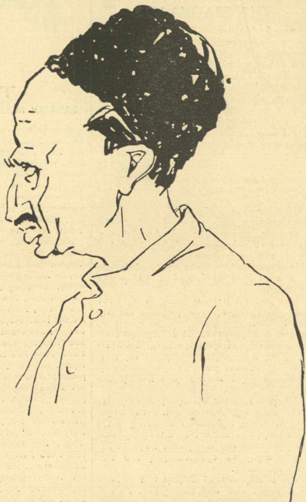
ΑΙΧΜΑΛΩΤΟΣ ΤΟΥΡΚΟΣ ΑΞΙΩΜΑΤΙΚΟΣ