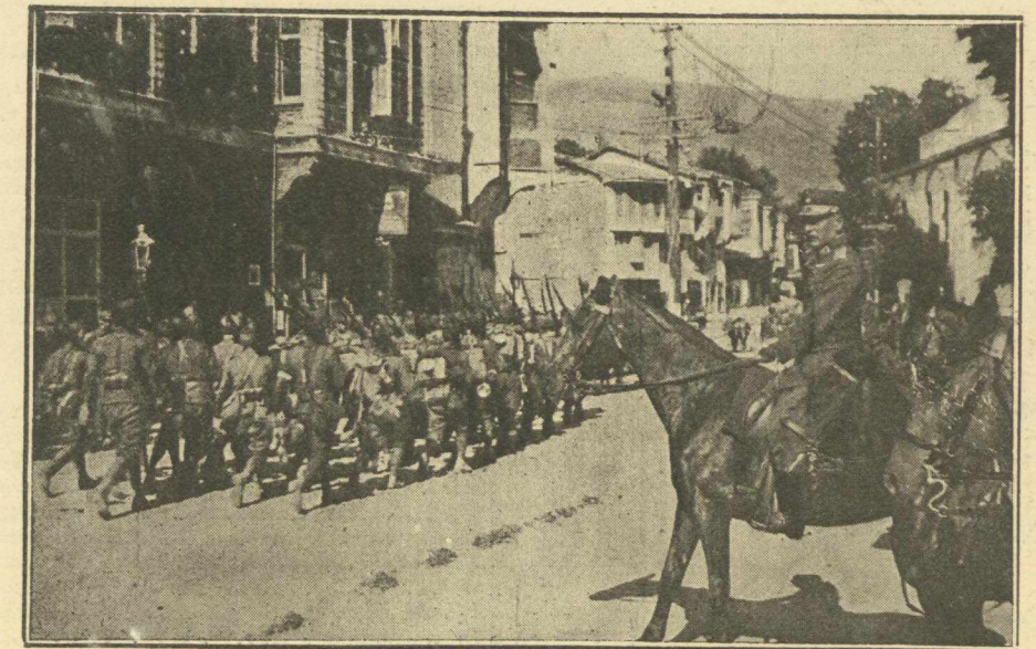
ΠΡΟΥΣΣΑ.—'Ο Στρατηγὸς Πολυμενᾶκος ἐπιθεωρῶν τὸ βον σύνταγμα Ἀρχιπελάγους.