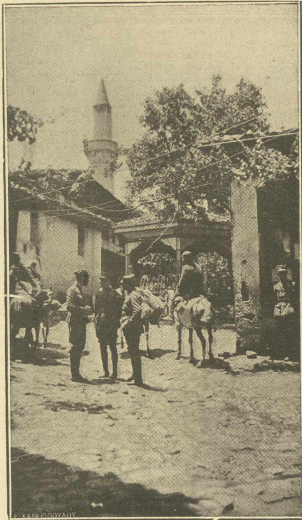
ΑΠΟ ΤΟ ΜΕΤΩΠΟΝ.—'Η συζήτησις τῶν πολεμικῶν νέων, μέσα στὰ καλντερίμια τῆς Κιουταχείας.