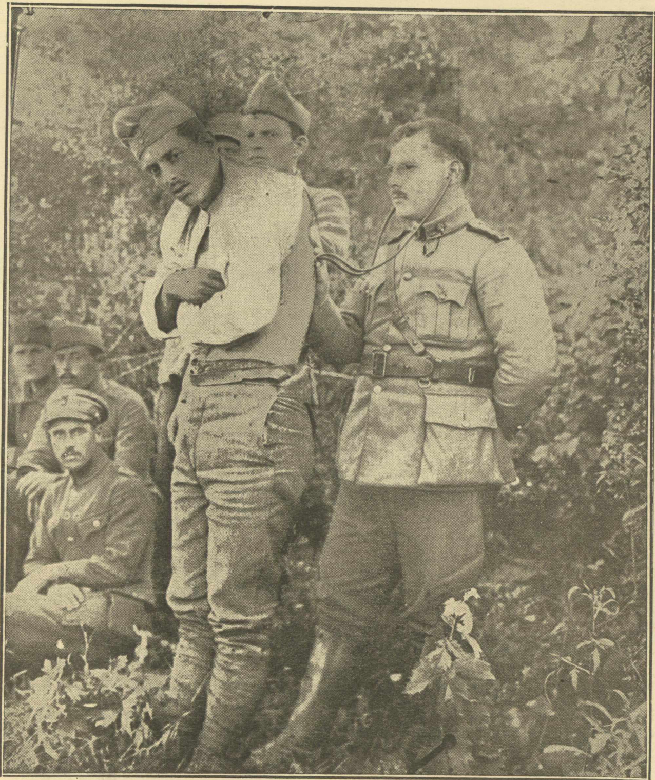
ΑΠΟ ΤΟ ΜΕΤΩΠΟΝ. — Ίατρική επίσκεψις εἰς τὰ χαρακώματα.