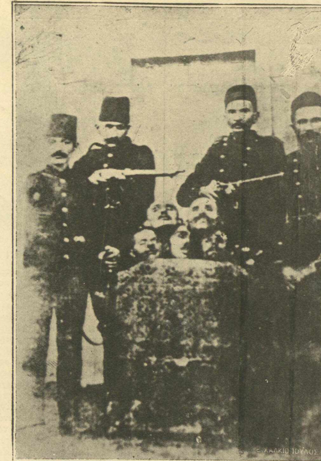
ΚΕΜΑΛΙΚΟΣ ΠΟΛΙΤΙΣΜΟΣ.—'Η εἰκὼν μας παριστᾷ ἕνα κάρτ ποστάλ κυκλοφοροῦν εἰς τὸ κεμαλικὸν Κράτος καὶ ἀποδεικνύον τὴν ἀναδιοργάνωσιν τῆς κεμαλικῆς Χωροφυλακῆς. Πράγματι αἱ ἐπιδεικτικῶς τοποθετημέναι κεφαλαὶ σφαιρασθέντων Ἑλλήνων, μαρτυροῦν τὴν ἐκπολιτιστικὴν ἀναδιοργάνωσιν.