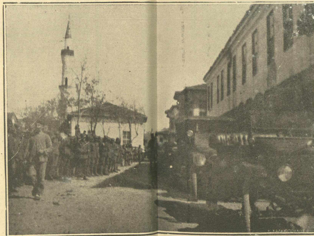
ΑΠΟ ΤΟ ΜΕΤΩΠΟΝ.—Πρὸ τοῦ Γενικοῦ Στρατηγείου.