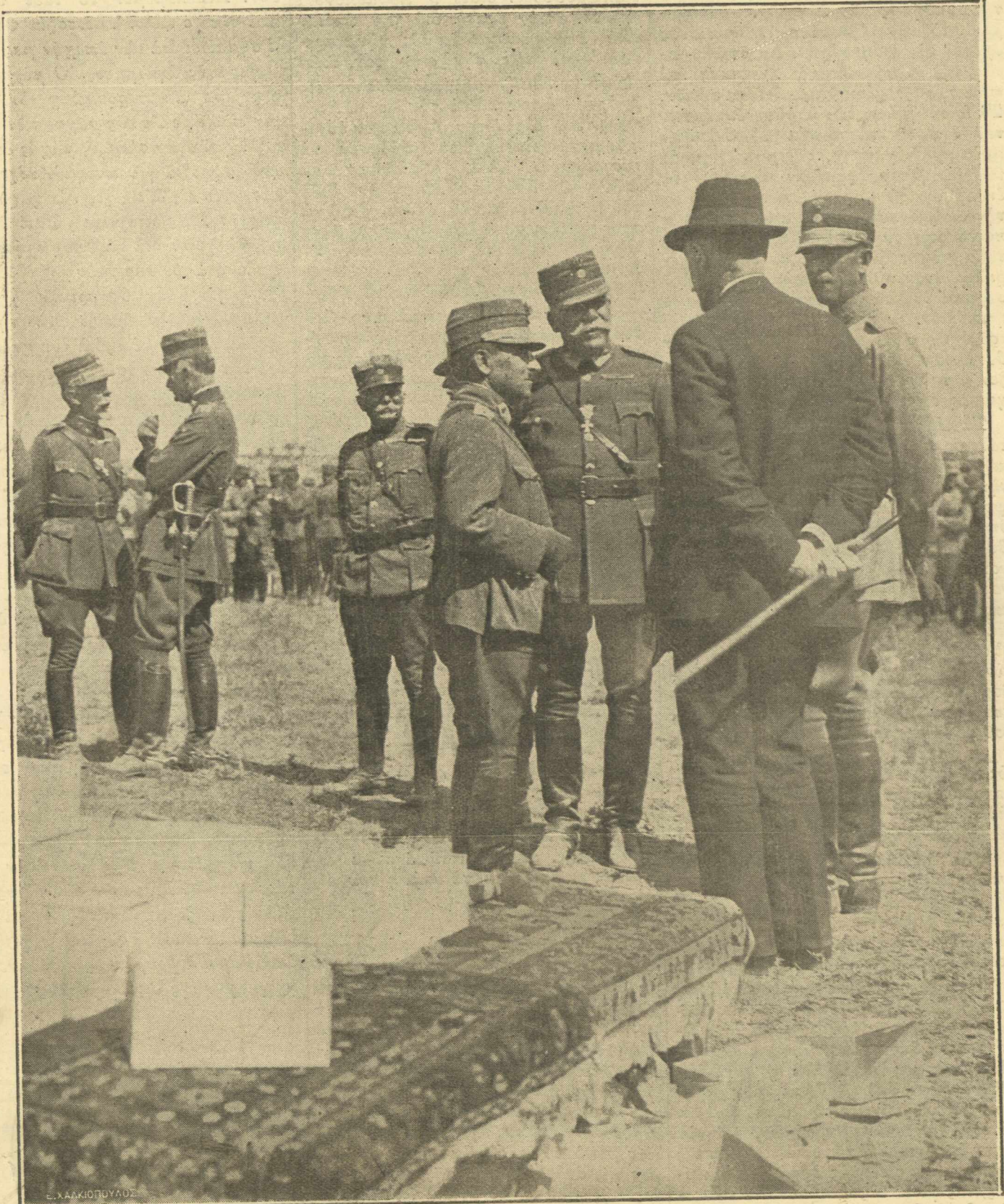
Συγκέντρωση τών επίσημων κατά την τελετήν τής παρασημοφορίας εν άναμονή του Βασιλέως