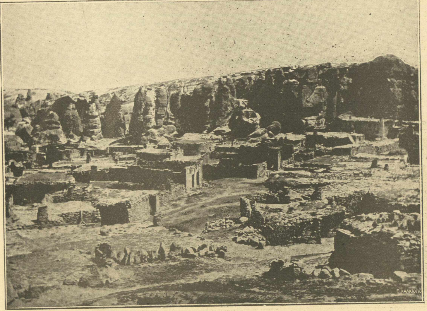
Τό χωριόν 'Ισλίμ-Κιοϊ μετά την αποτέφρωσίν του υπό των Τούρκων

Επειτα από πορείαν μίς ώρας συντηήσαμεν άλλο ελληνικόν χωριόν με εκκλησίαν που είχε γίνει παρανάλωμα του πυρός. Τό χωριό αυτό τό όποιον διηρητίτο εις τέσσαρας μεγάλας χωρισμένες συνοικίας, ήτο τό περιφημον και πλούσιον Φουντουκλί, του όποιου οι περισσότεροι κάτοικοι έσφαγήσαν από τούς Τουρκοους. (Ακολουθεί)