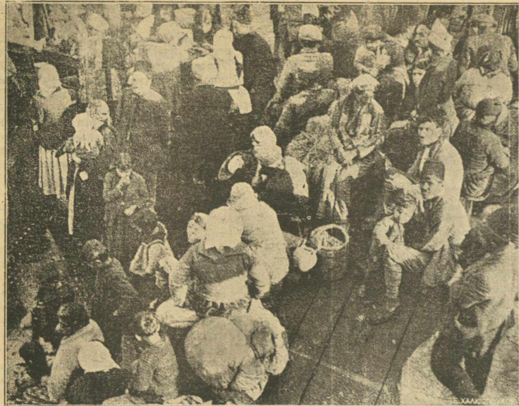
ΕΠΙ ΤΟΥ «ΒΑΣΙΛΕΩΣ ΚΩΝΣΤΑΝΤΙΝΟΥ». — Έλληνες και Αρμένιοι φεύγοντες τὸ μαχαίρι τοῦ Τούρκου μεταβαίνουν εἰς τὴν Σμύρνην.