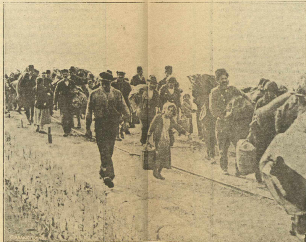
ΠΡΟΣ ΤΗΝ ΣΜΥΡΝΗΝ. — Καὶ τώρα μετὰ τὴν ἀπολύμανσιν πρὸς τὴν Σμύρνην ἢ ὅπου ἄλλοῦ ὄρισεν ἄστυλὸν ἢ Ἐλευθερά Ἑλλάς.