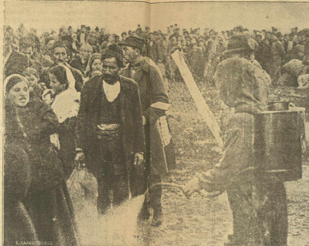
ΕΙΣ ΤΟ ΛΟΙΜΟΚΑΘΑΡΤΗΡΙΟΝ ΤΩΝ ΚΛΑΖΟΜΕΝΩΝ. Λόγω τῆς προσβολῆς τὰ θύματα ἐπιδημίας τῆς εὐλογίας ἢ ὑπερσείας ἀπολυμνωσθεὶς ἐτέθη ἐπὶ τὸ ἔργον.