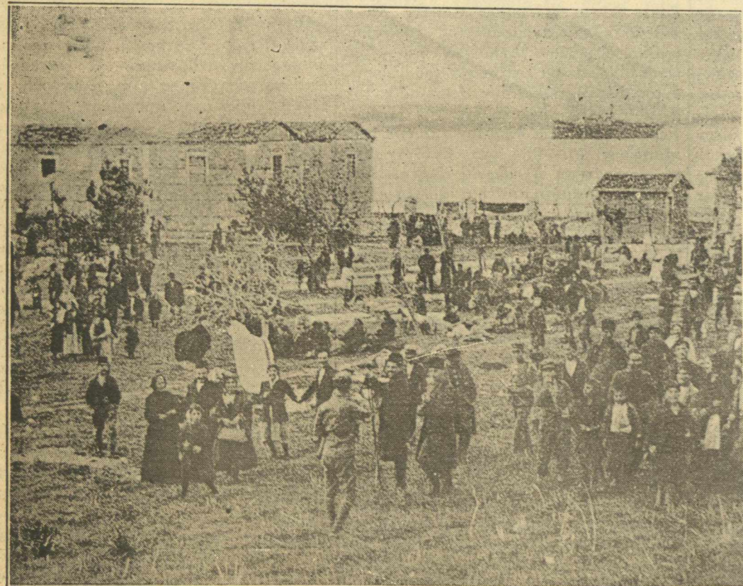
ΕΙΣ ΤΑΣ ΚΛΑΖΟΜΕΝΑΣ. — Ἦτο τόση ἡ χαρὰ των διότι ἐπάταν ἐπὶ «Ἑλλάδος» ὥστε ἅμα τῇ ἀποβίβασει των τὸ ἔστρωσαν εἰς τὸν χορόν.