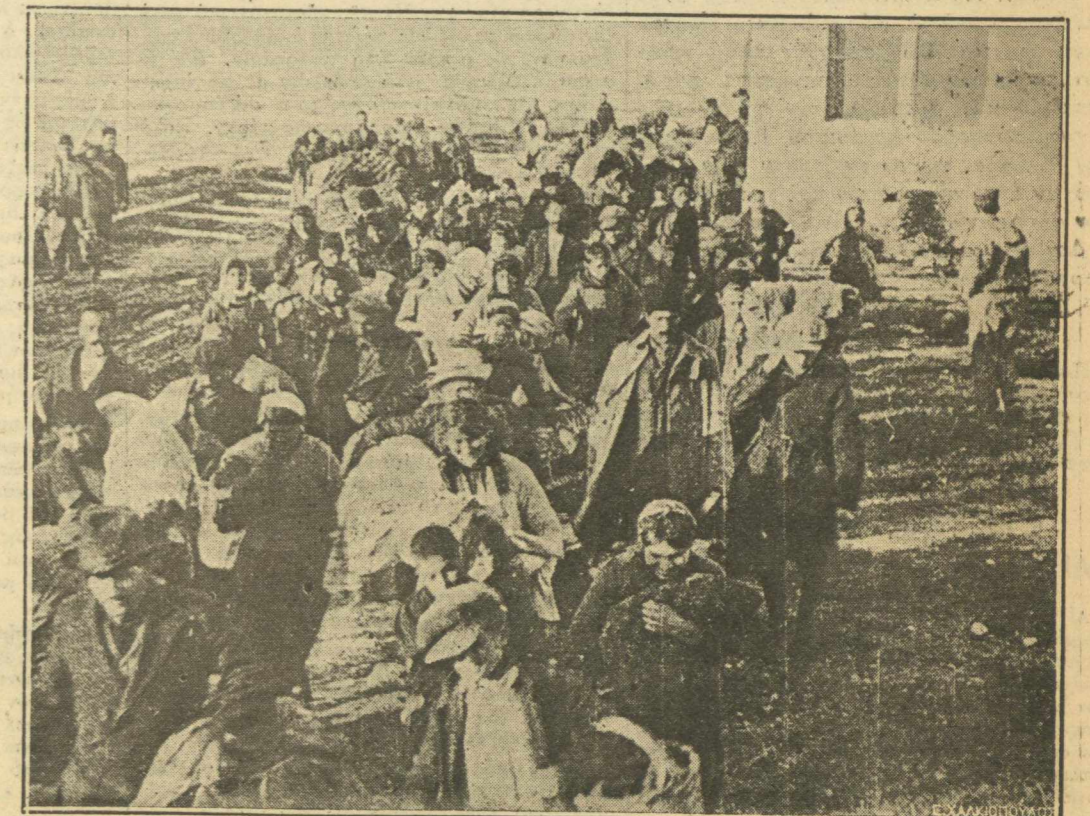
ΟΙ ἈΡΜΕΝΙΟΙ. — Αρμένιοι ἐξερχόμενοι τοῦ λοιμοκαθαρηθρίου τῶν Κλαζομένων.