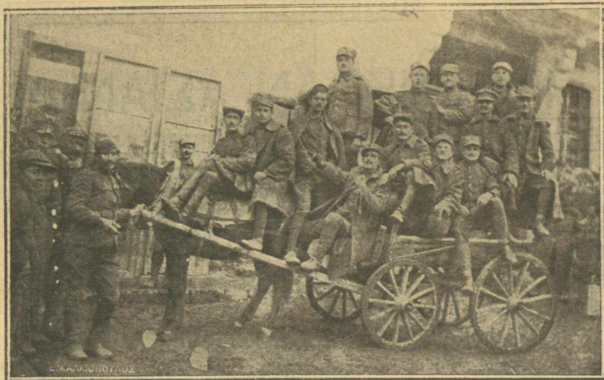
Οι άνδρες του Α' Συντάγματος Πεδινού Πυροβολικού επάνω εις ένα άραμπά ποζάροντες μετά την εορτήν.