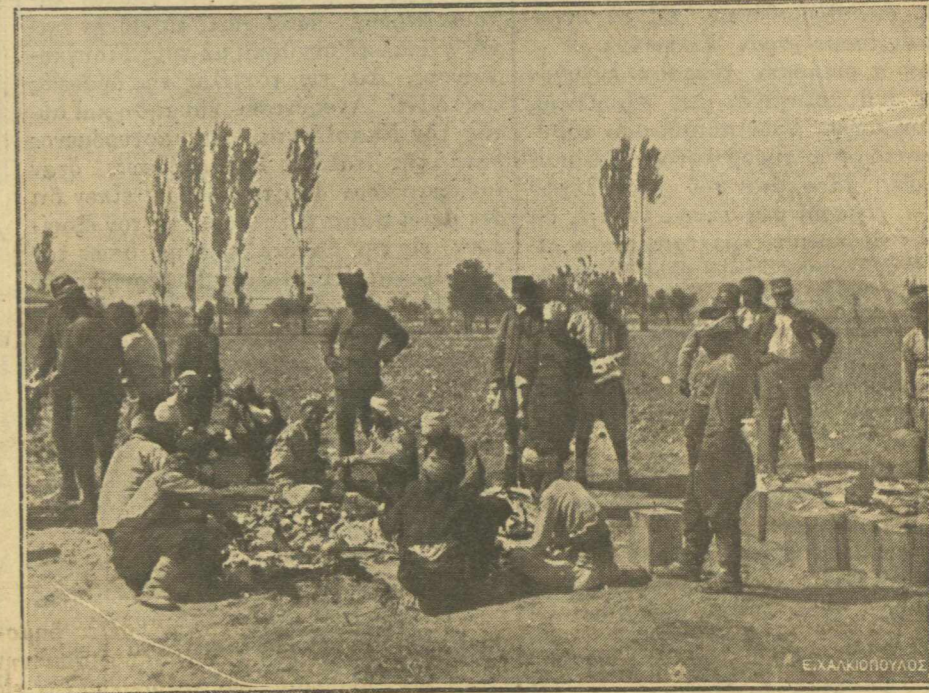
Τούρκοι αἰχμάλωτοι παρασκευάζουσι τὸ σουσιτίον των.

λων. Ἐπίσης δὲ διένειμεν ἡ Πυροβολοχία κατὰ τὴν αὐτὴν ὥραν ἀπὸ ἑνα ζευγὸς καλτῶν μαλλίνων, γνωρίσασα εἰς τοὺς πυροβολητὰς ὅτι προέρχεται ἐκ τὴς Α. Μ. τὴς Βασιλίσσης. Ἀπερίγραπτος ἡ χαρὰ τῶν πυροβολητῶν ἀπ' ἐνὸς μὲν ἐκ τοῦ καλοῦ σουσιτίου, ἀπ' ἑτέρου δὲ ἐπὶ περισσότερον ἐκ τοῦ δώρου τὴς Α. Μ. τὴς Βασιλίσσης. Ἡ διανομὴ τοῦ σουσιτίου τελείωσε τὴν 12 ὥραν ὅτε οἱ κ. κ. ἀξιωματικοὶ μας μετέβησαν εἰς τὴν κατοικίαν των (πολεμικὸν ἀμπρί). Ἐπειδὴ ὁ καιρὸς και τὸ μέρος τῶν οἰκημάτων μας (ἀμπρίων) δὲν ἐπέτρεπε τὴν συγκέντρωσιν τὴς πυροβολοχίας εἰς ἑν μέρος, ἐχωρίσθημεν εἰς δύο. Οἱ μὲν τοῦ 1ου οὐλαμοῦ εἰς τὸ ἀμπρί τοῦ 2ου Στοιχείου οἱ δὲ τοῦ 2ου οὐλαμοῦ εἰς τὸ 4ου Στοιχείου.