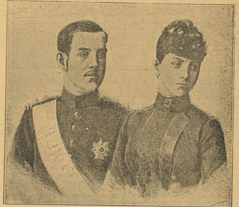
ΣΤΟΥΣ ΓΑΜΟΥΣ ΤΟΥ.—'Αλησμόνητος ημέρα διά τὸ Πανελλήνιον, ἡ ημέρα τῶν γάμων του. Αἱ εὐχαὶ τοῦ ἐλευθέρου καὶ δούλου 'Ελληνισμοῦ συνώδευσαν τὴν εὐτυχὴ αὐτὴν ένωσην.