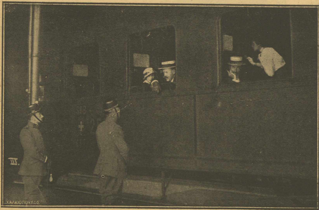
ΕΡΧΕΤΑΙ.—Τὸ τραῖνο ἐξεκίνησε καὶ ὁ Βασιλεὺς Κωνσταντίνος ὑπακούων εἰς τὴν διά τοῦ δημοψηφίσματος διακηρυχθεῖσαν ἀπόφασιν τοῦ 'Ελληνικοῦ Λαοῦ, ἐπιστρέφει εἰς τὴν ἀγαπητὴν του 'Ελλάδα μετὰ τὴν ἀνάμνησιν τῆς φιλοξένου 'Ελβετίας.