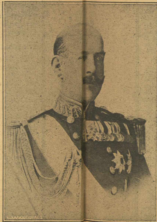
ΝΑΥΑΡΧΟΣ.—Ὅταν ἐπισκέφθη τὸν θρυλικὸν «'Αβέρωφ» μετὰ τὸ εὐτυχὲς τέλος τοῦ Βουλγαρικοῦ πολέμου, ἐνεφανίσθη μετὰ τὴν στυγερὰν τοῦ ναυάρχου προκαλέσασ φρενιτιδα ἐνθουσιασμοῦ μεταξὺ τῶν ἀξιωματικῶν καὶ τοῦ πληρώματος τοῦ τῶν ἐβλεπαν ἀρχηγό.