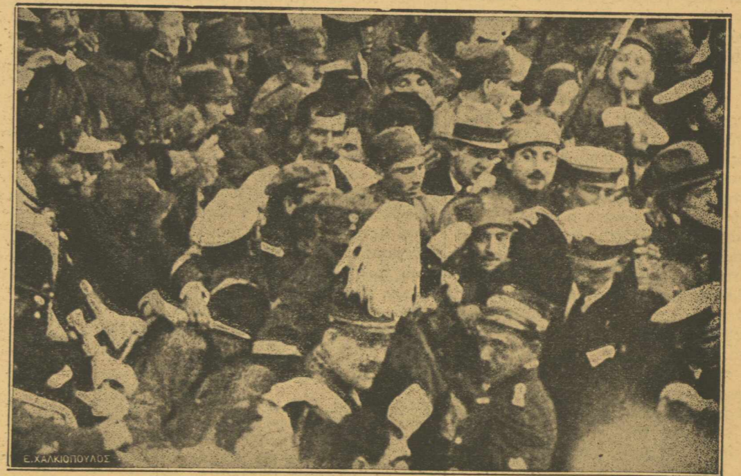
ΤΟΝ ΕΦΕΡΑΜΕ.—Δὲν ὑπάρχει στὴν ἱστορία τοῦ κόσμου παρόμοια σελίδα. Κανεὶς βασιλεὺς δὲν ἠτύχησε νὰ τὸν ἀγαλιάσει ὁ λαὸς του ἔτσι, ὅπως ὁ λαὸς τῶν 'Αθηνῶν τὸν λατρευτὸν του Κωνσταντίνον κατὰ τὴν ἀλησμόνητον ἡμέραν τῆς Κυριακῆς 6 Δεκεμβρίου 1920.