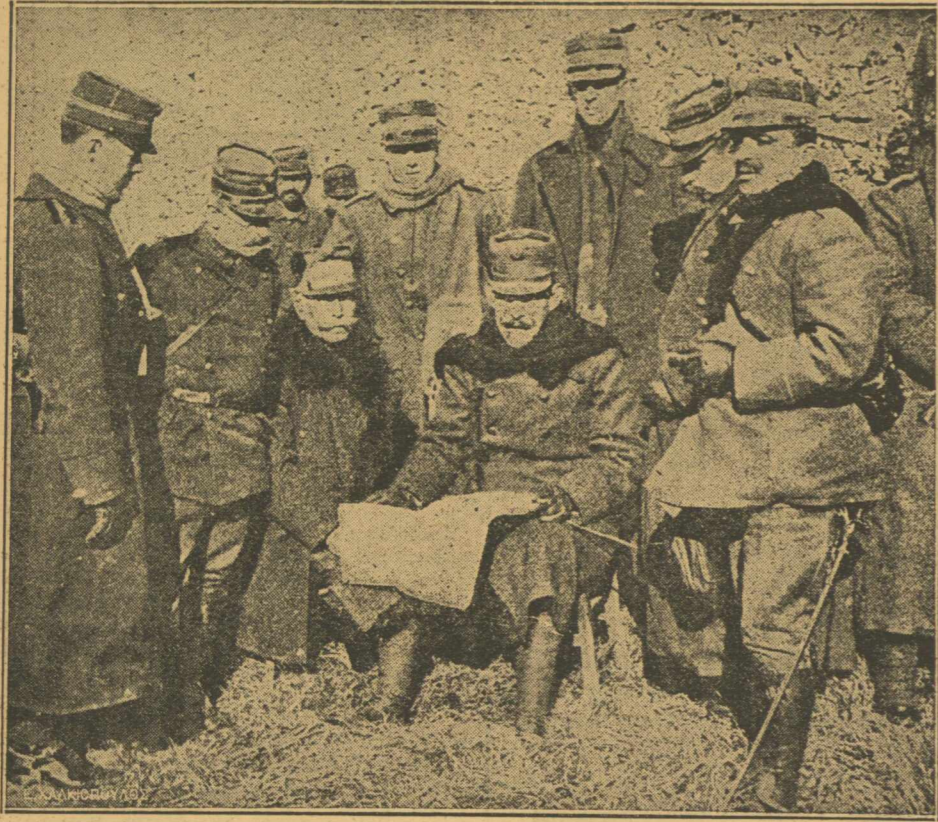
ΣΤΟ ΜΠΙΖΑΝΙ.—Ο 'Αρχιστράτηγος, εν μέσω των Πριγκίπων και του 'Επιτελείου σχεδιάζει την ιστορικήν εκπόρθησιν του Μπιζανίου.