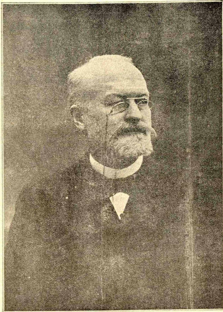
Ὁ Γάλλος Ἀκαδημαϊκὸς A. LAVERAN

Ὁ ἀνακαλύψας τὸ μικρόβιον τῶν ἐλειογενῶν νόσων.