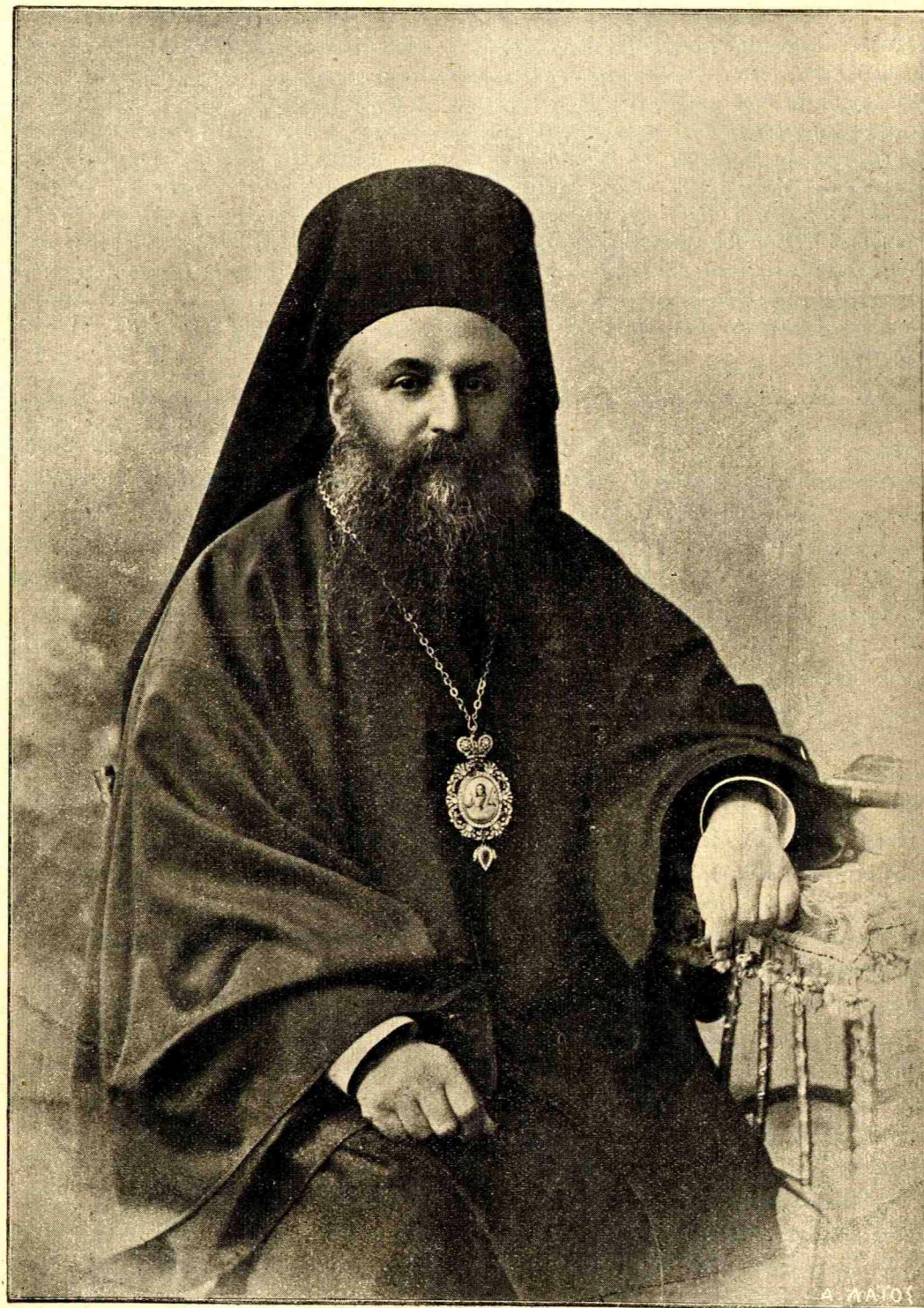
Η Α. Σ. Ο ΜΗΤΡΟΠΟΛΙΤΗΣ ΑΘΗΝΩΝ ΘΕΟΚΛΗΤΟΣ

Κατὰ τὰν ἐρεύνας τῶν δεινῶν ἀνατομοπαθολόγων Malassez, Ranvier, Sappey, τὰ κύτταρα τοῦ ἐγκεφάλου τῶν τοιούτων ἀσθενῶν ἐκφυλίζονται, ὑφιστάμενα τὴν λιπώδη ἐκφύλισιν· (λιπώδη ἐκφύλισιν λέγοντες ἐνοοῦμεν τὴν κατάστασιν ἐκείνην τῶν κυττάρων διαφόρων ὀργάνων, καθ' ἣν παρουσιάζεται εἰς τὸ πρωτόπλασμα αὐτῶν μέγας ἀριθμὸς λεπτοτάτων σταγονιδίων ἢ κοκκίων λίπους, ἅτινα δύνανται μικρὸν καὶ κατ' ὀλίγον διὰ τῆς παρουσίας αὐτῶν καὶ τῆς κατ' ὄγκον αὐξήσεως ν'