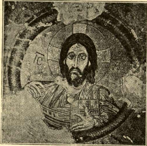
ΙΗΣΟΥΣ Ο ΠΑΝΤΟΚΡΑΤΩΡ

Ὅσον ἀφορᾷ εἰς τὰς συνθέσεις, αὗται, ὡς ἐν Ὁσίῳ Λουκᾷ καὶ Νέξ Μονῆ, διανέμονται ἐν τε τῷ κυρίως ναῷ καὶ τῷ νάρθηκι, ἀναφέρονται δ' εἰς τὰς κυριωτέρας ἐορτάς τοῦ Χριστοῦ καὶ τῆς Θεοτόκου. Ἡ δια-