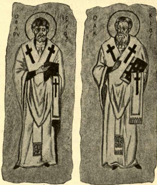
ΕΛΕΥΘΕΡΙΟΣ ΚΑΙ ΑΒΕΡΚΙΟΣ

Αἱ κόγχαι και αἱ πλαγίαι πλευραὶ τῶν μικρῶν μύακων εἶναι κεκοσμημένα ὑπὸ προτομῶν ἁγίων· έν μὲν τῇ Προθέσει εἰκονίζονται ὁ Πρόδρομος μετὰ τῶν ἀρχιερέων τῆς Παλαιᾶς Διαθήκης 'Ααρῶν και Ζαχαρίου· έν έν δέ τῷ Διακονικῷ εἰκονίζονται τρεῖς ἐπίσκοποι, Νικόλαος, Γρηγόριος ὁ