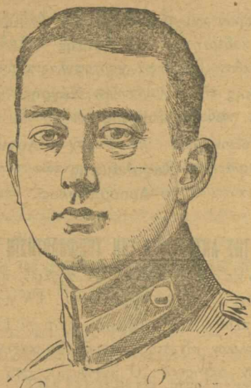
Fliegerleutnant Voss 'Ο αεροπόρος ανθυπολοχαγός Φός.