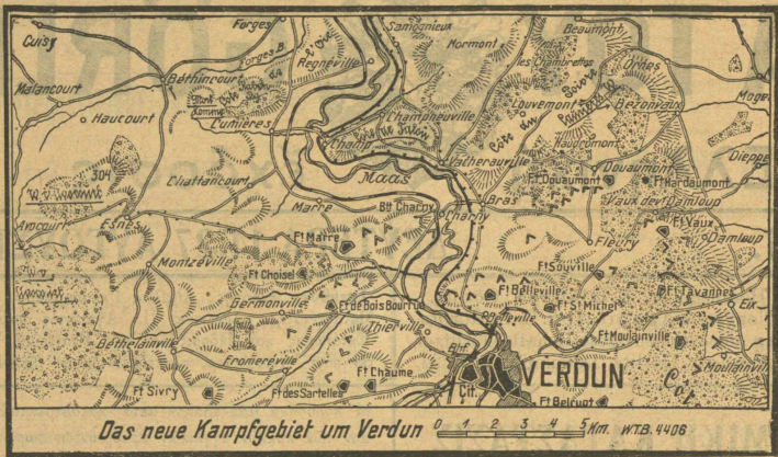
Από την νέαν μεγάλην επίθεσιν του Βερντέν.

εξάμηνον του άπεριορίστου ύποβρυχίου πολέμου είναι κατώτερα των προϋπολογισθεισών, και ότι τα κατά την παρούσαν στιγμήν δρώντα γερμανικά ύποβρυχία είναι κατά 10 επί τοις εκατόν περισσότερα παρά κατά τας άρχάς Φεβρουαρίου. Κατά τούδε παρελθόντας έξ μήνας κατεβυθίσθησαν περίπου 5½ εκατομμύρια μπουττό-τόνων, τούτέστι κατά μέσον όρον 920 000 τόνων μηνιαίως, άποτέλεσμα, τó όποιον ύπερβη κατά 50 επί τοις εκατόν τας προσδοκίας τού ναυτικού. Έάν κατά τούδε διάφορους μήνας παρατηρούνται ταλαντεύσεις εις τó ποσόν των καταβυθίσεων, τούτο όφελείται εις την φύσιν και την τεχνικήν τού ύποβρυχίου πολέμου.