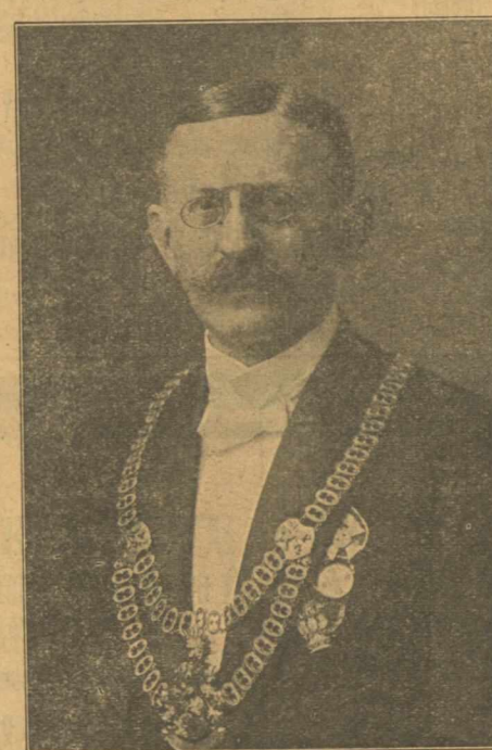
Ο ΔΗΜΑΡΧΟΣ ΤΗΣ ΠΟΛΕΩΣ ΓΚΕΡΛΙΤΣ ΚΑΙ ΜΕΛΟΣ ΤΟΥ ΚΟΙΝΟΒΟΥΛΙΟΥ κ' ΣΝΑΪ

Βερολίνον 7.11. Εἰδήσεις τῶν πρωϊνῶν ἐφημερίδων. Περὶ τοῦ φορτίου τοῦ γερμανικοῦ ἐμπορικοῦ ὑποβρυχίου "Γερμανία., τὰ φύλλα ἀναγράφουν: Τὰ τελωνεῖον τῆς Κοννεκτικούτης (Ἀμερικῆς) πληροφοροῦσι, ὅτι τὸ φορτίον τῆς "Γερμανίας., εἶναι ἀξίας περίπου 10 ἑκατομμυρίων δολλαρίων.