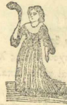
Θεά της αδικίας