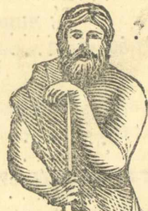
ὁ τῶν Ἐγεκρατίδου