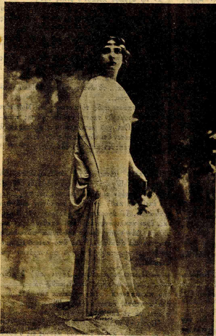
ΑΝΘΟΣ ΤΟΥ ΒΑΡΟΣ

Ο άνθρωπος ούτος είναι μελανέμων και φάνεται γηράσας κατά πενήτηντα έτη.