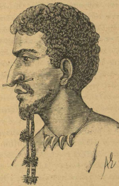
Αὐτόχθων τῆς Γουϊνάας.

Αἱ ταξιονομίαι τῶν ἀνθρώπινων φυλῶν λαμβάνουσιν ὡς βᾶσιν τοὺς φυσικοὺς χαρακτήρας ὡς τὴν φύσιν τῶν τριχῶν, τὸ χρῶμα τοῦ δέρματος, τὸν σχηματισμὸν τοῦ κρανίου καὶ τὸν τῆς ρινός· ἀλλὰ τὸ πλεῖστον τῶν ταξιονομιῶν τούτων μόνον τὴν βᾶσιν ἔχουσιν ἐπιστημονικὴν, εἰσερχόμεναι δὲ εἰς τὰς δευτερευούσας διαίρεσεις καθίστανται μᾶλλον ἢ ἠττον ἀθηαίρετοι. Κατὰ τοὺς τελευταίους τούτους χρόνους ἡ ἀνθρωπολογία κατέστη εἰδικὴ ἐπιστήμη φωτιζομένη διὰ τῆς ἐθνολογίας, τῆς γλωσσολογίας, τῆς ἱστορίας. Ἀλλ' ὅμως πολλὰ αὐτῆς σημεῖα μένουσιν ἔτι ἐν τῷ σκότει.