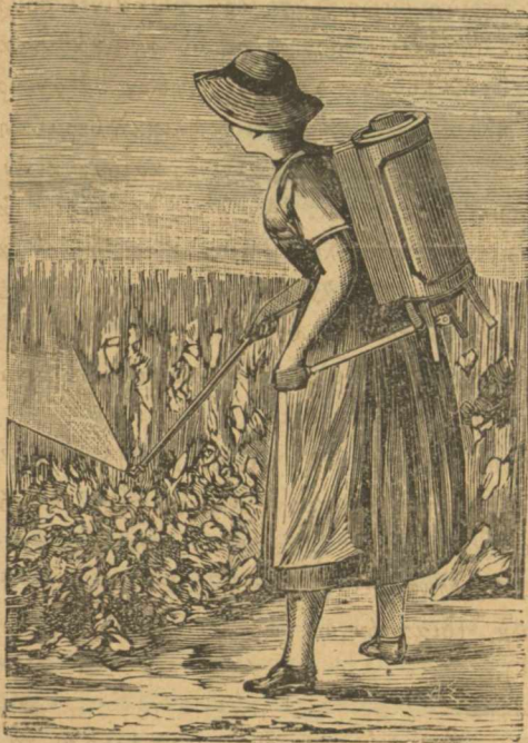
Ψεκαστὴρ τοῦ Noël

Ἡ δευτέρα εἰκὼν δεικνύει τὸν τρόπον καθ' ὃν γίνεται ἡ ψεκασίς τῶν ἀμπέλων διὰ τοῦ ψεκαστή- ρος τοῦ Noël. Ὁ ψεκαστὴρ οὗτος συνίσταται ἐξ ἑ- νὸς δοχείου, τὸ ὁποῖον χρησιμεύει ὡς ἀποθήκη τοῦ ὑ- γροῦ, ἐξ ἑνὸς ἀπαγωγῶ ὠληθρος, δι' οὗ ἐξακοντίζεται τὸ ὑγρὸν κατὰ λεπτοτάτας ψεκᾶδας καὶ ἐξ ἑνὸς μη- χανήματος, ὅπερ πιεζόμενον διὰ τῆς ἀριστερᾶς χειρὸς μετακινεῖ τὸ ἐντὸς τοῦ δοχείου ὑγρὸν καὶ ἐξωθεῖ αὐτὸ πρὸς τὸν ἀπαγωγὸν ὠληθρα. Ἐσχάτως μάλιστα ὁ ψε- καστὴρ οὗτος ὑπέστη καὶ τροποποιήσεις, δι' ὧν εἶνε δυνατὸν διὰ πολὺ μικρᾶς σχετικῶς δυνάμεως νὰ ἐξα- κοντίζεται τὸ ὑγρὸν εἰς ἀπόστασιν λεπτότατα διαμε- μερισμένον.