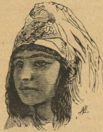
Γυνὴ τοῦ Khartoum

νομικούς τινας σχηματισμοὺς ἀποτελοῦντας τὰς φυλάς ἢ τὰς ποικιλίας. — Κυρίως εἰς τὸ χρῶμα τοῦ δέρματος καὶ τὴν σπουδὴν τοῦ ἀνθρώπινου κρανίου στηρίζονται αἱ διαίρεσεις αἱ γενόμεναι δεκταὶ ὑπὸ τῶν φυσιοδίφων. Ἀπὸ μακροῦ ἤδη χρόνου παρατηρήθη ὅτι