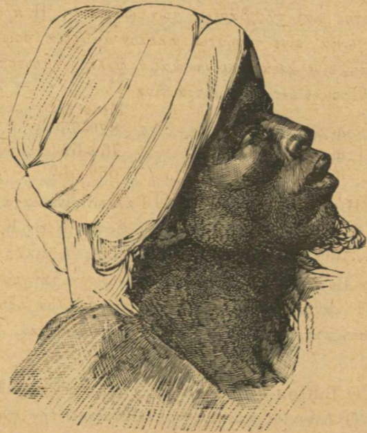
Αὐτόχθων τοῦ Darfour

Ἀφ' ἐτέρου αἱ γλυφαὶ καὶ αἱ γραφαὶ τῶν Αἰγυπτιακῶν μνημείων ἀποδεικνύουσιν ἡμῖν ὅτι οἱ εἰδικοὶ χαρακτήρες ἐκαστῆς φυλῆς εἰσὶν ἴδιοι καὶ ἀνεξίτηλοι καὶ οὐδαμῶς ἀνήκουσιν εἰς τὸ κλίμα, ἢ μᾶλλον ἠτῶν ἀνθρώπων διασπορὰ ἐπὶ τῆς γῆς· ἀνέρχεται εἰς χρόνους ἀρχαιοτάτους· τούτο δ' ἄλλως θὰ συνεφώνει οὐ μόνον πρὸς τὰς ἀρχαιοτάτας ἱστορικὰς παραδόσεις τῆς Αἰγύπτου, ἀλλὰ καὶ πρὸς τὰς νεωτέρας γεωλογικὰς ἀνακαλύψεις.