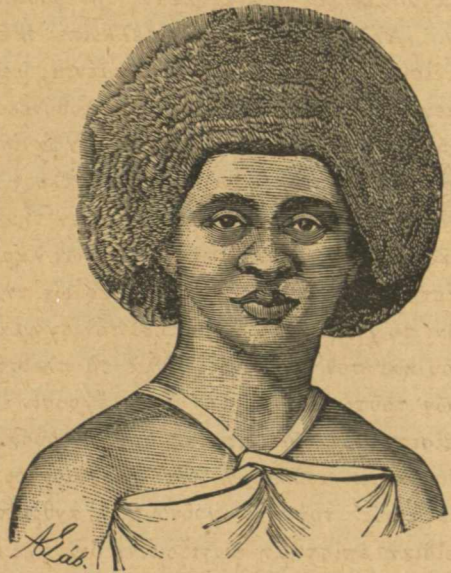
Γυνὴ τῆς Γουϊνάας

Ἀπὸ μακροῦ ἀνεκινήθη τὸ ζήτημα ἐὰν αἱ διαφοροὶ ἀνθρώπινοι φυλαὶ ἀνήκουσιν εἰς ἓν εἶδος ἢ ἐν ἐκαστῇ χώρᾳ κέκτηται τὰ ἰδιόζοντα αὐτῆς εἶδη πο-