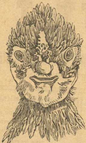
Κεφαλή θεωμένη κατ' ὄψιν.

λης ἀλεκτορίδος, ἐξαγριούται καὶ μάχεται ὡς ὁ ἀλέκτωρ· ὅταν δ' ἴδῃ ἀλέκτορα καταλαμβάνεται ὑπὸ δέους καὶ ἀμέσως κρύπτεται. Ἀποφεύγει τὸν ἥλιον κρυπτομένη ἢ εἰς τὰ χόρτα ἢ καταφεύγουσα εἰς τὸ