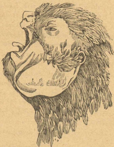
Κατὰ κρόταφον μετ' ἀνοικτοῦ ράμφους. μαχειρεῖον. Τὸ ζῖον τοῦτο ἀγαπᾷ εἰς ἄκρον τὴν μετ' ἀνθρώπων συμβίωσιν. Οἱ πόδες αὐτῆς εἶνε παχύτατοι, ἰσχυρότατοι καὶ καλύπτονται ὑπὸ λεπῶν σκληρῶν καὶ πυκνῶν, στερεῖται ὀνύχων κατὰ τοὺς μεγάλους δακτύ-

λους, ἀγνοεῖ ὅμως ὁ κύριος ταύτης ἂν τοῦτο προῆλθε τυχαίως ἢ ἐκ γεννητῆς εἶχεν οὕτως, διότι ὅταν ἔλαβε ταύτην ἦτο τεσσαρῶν μηνῶν. Κατὰ τὴν ἐποχὴν δ' ἐ- ἐκείνην ἠλλάσσε τὰ πτερὰ καὶ ἐξακολουθεῖ τοῦτο ἔτι. Ἡ ὕψεια αὐτῆς ἔχει κελῶς, ἐπειδὴ δ' ὅμως ἀναγκαιῶς τρέφεται ἀνεπαρκῶς τὰ πτερὰ δὲν ἐκφύονται εὐρωστα. Ἡ γλῶσσα αὐτῆς εἶνε παχεῖα κατὰ τὴν βᾶσιν ἀπο- λήγουσα εἰς αἰγμὴν, ἐκ τῶν ὀνύχων δ' ἐλλείπουσιν εἰς ἐκ τοῦ ἀριστεροῦ ποδός, καὶ δύο ἐκ τοῦ δεξιοῦ.