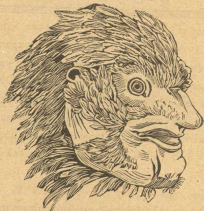
Κεφαλή θεωμένη κατὰ κρόταφον μετὰ κεκλεισμένου ράμφους