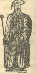
Βασιλεύς της Αιγύπτου και Θεμελιωτής της Μέμφιδος