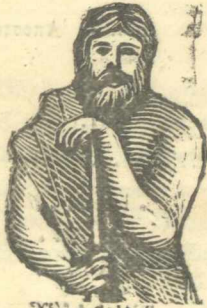
Υιός του 'Ανίου, περίφημος μάντις.