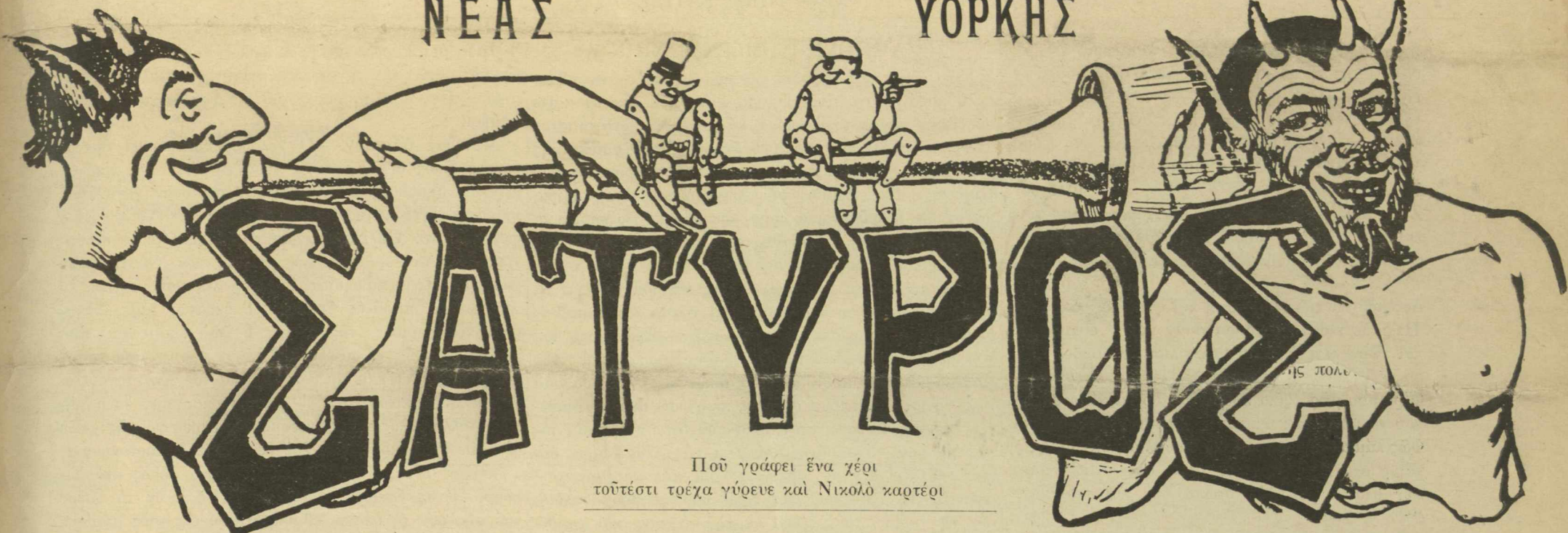
Ποῦ γράφει ἓνα χέρι τοῦτέστι τρέχα γύρευε καὶ Νικολὸ καρτέρι

Τὴν ἑβδομάδα μιὰ φορά ὁ «Σάτυρος» θὰ βγαίνει καὶ τὸ ξερὸ κάθε Ρωμηοῦ στὴν τσέπη του θὰ μπαίνει μὲ πέντε σέντσια μοναχὰ τὸ φύλλο ν' ἀγοράζη νὰ κάνη γέλι' αὐτὸς μὲ μᾶς καὶ μεις μ' ἐκείνον χάζι.