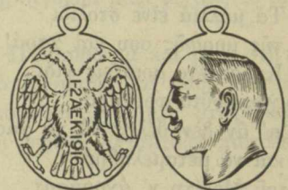
ΜΕΤΑΛΛΙΑ ΔΙΑ ΚΑΔΕΝΑΣ

Δὲν φανταζόμεθα βεβαίως ὅτι ὁ Πρόεδρος τῶν Ἠνωμένων Πολιτειῶν, εἰς τὰς χεῖρας τοῦ ὁποῖου ἔγκειται ἢ τύχη καὶ ἢ ζῶη τῆς Ἑλλάδος, ἀγνοεῖ τοὺς λόγους, οἵτινες ὑπηγόρευσαν τὴν τεχνικὴν ἐκείνην ἐπανάστασιν, εἰς τρόπον ὥστε εἰμῆθα ἀκραδάντως πεπεισμένοι ὅτι σήμερον δὲν θὰ λησμονήσῃ ἑαυτὸν, ἀναγνωρίζων μίαν Κυβέρνησιν, οὐδὲν κοινὸν ἔχουσαν πρὸς τοὺς πόθους καὶ τὴν θέλησιν τῆς πλειονότητος τοῦ Ἑλληνικοῦ λαοῦ. Τὸ κίνημα τῆς Θεσσαλονικῆς ἀπέτυχεν οἰκτρῶς, καὶ ἢ ἐπισημοποίησις του διὰ τῆς ἀναγνώρισεως παρὰ τῆς μᾶλλον φιλελευθέρας Κυβερνήσεως δὲν θὰ προσέθετεν εἰμὴ αἱματηρὰς μόνον σελίδας εἰς τὴν ἱστορίαν τῆς δυστήνου Ἑλληνικῆς Πατρίδος.