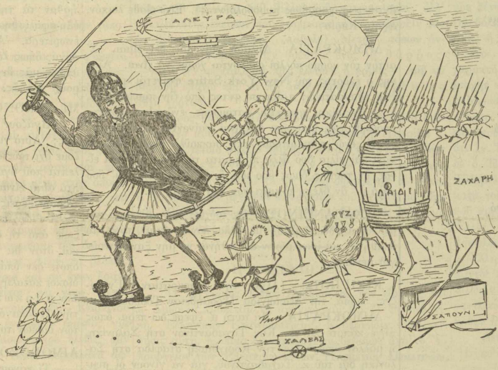
Ὁ Μέγας Ἐδεογέτης φουριόζος γιὰ τὴ μάχη, μὰ ξέχασε νὰ βάλῃ στὴ μέση τὸ σελάχι.

Ἀριθμὸς μας δεκατρία. Δίκες τοῦ μπερντέ καὶ κλίσεις καὶ μπορεῖ νὰ ξαφνιστοῦμε ἴσως καὶ μ' ἀναγνωρίσεις.