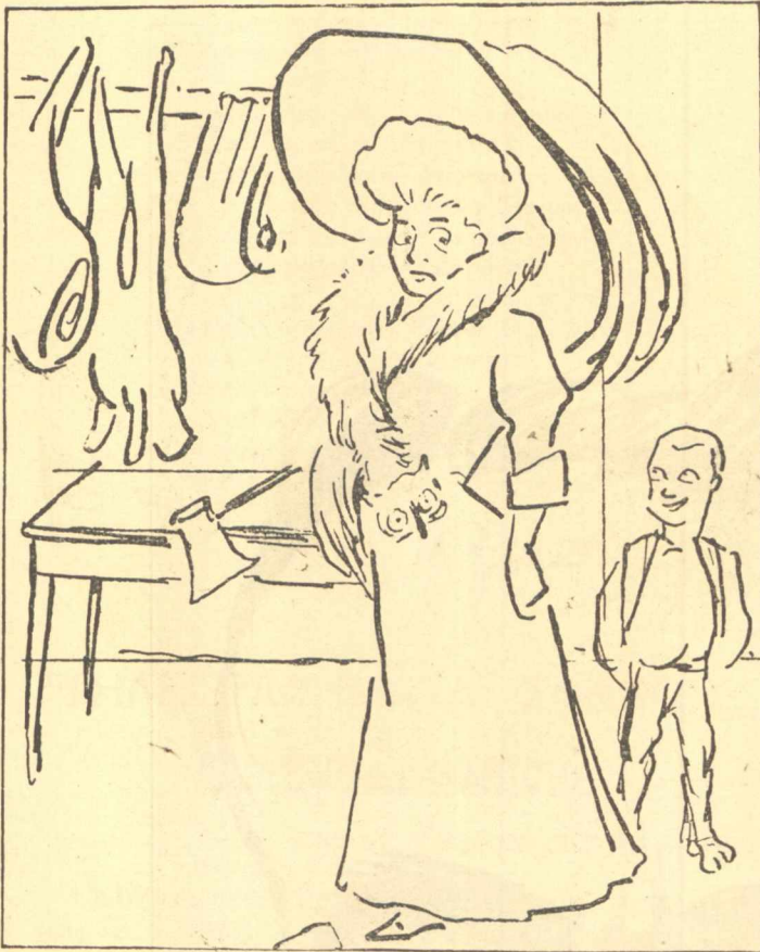
Τί θέλει ή άλεπού στο Παζάρι;

βιογραφία της, 40 κατά τὰ φαινόμενα, 29 κατά τήν όμολογία της, 20 κατά τήν ένδυμασίαν της, 12 κατά τήν όρθογραφία της.