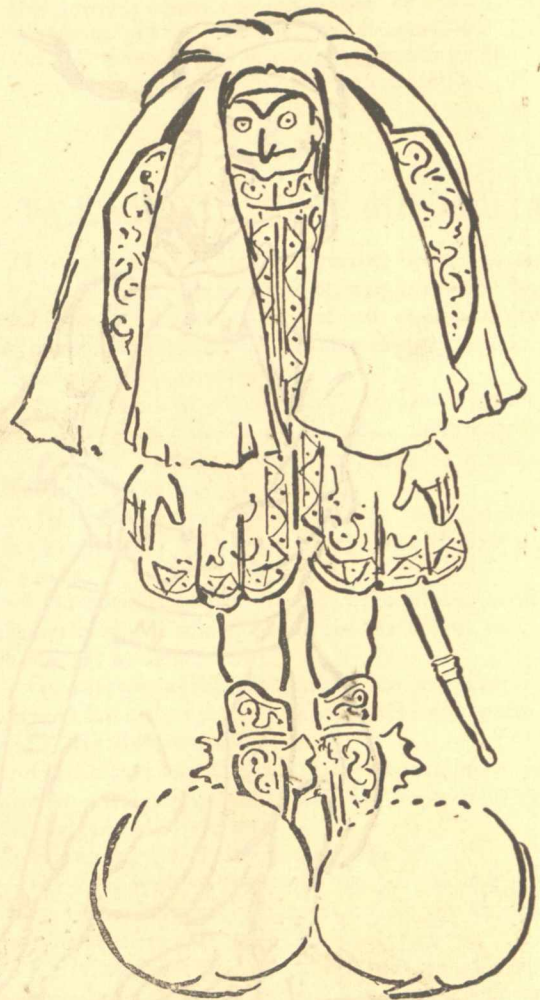
Ὁ νέος Εὐζωνος

Ἀθήναι (αὐθημερόν). Ἡ ἄδεια ἀπεφασίσθη νὰ δοθῇ, ἀλλ' ὁ ἐνοικιαστὴς δὲν θὰ εἰσπράξῃ οὐδὲ ἕβολόν, ἀφ' οὗ τὰς παραστάσεις ταύτας δὲν τὰς ἀκούῃ κανεὶς.