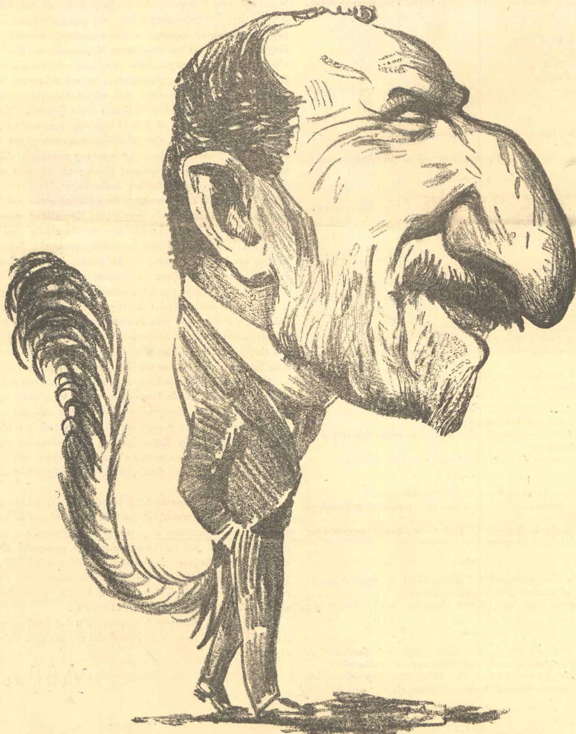
Ἡ ΠΙΟΝΗΡΟΤΕΡΑ ΑΔΕΛΠΟΥ ΤΟΥ ΚΗΠΟΥ