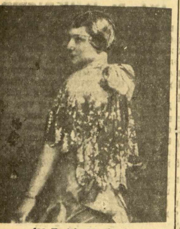
Η Ζωζώ Νταλμάς