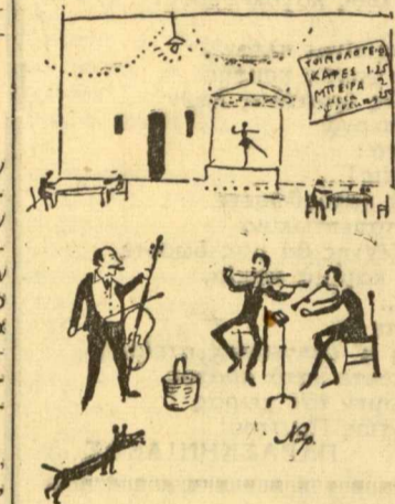
Το θεατράκι «Τριανόν» στο θέατρο Πατησίων.