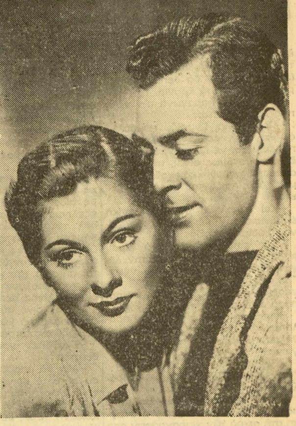
Η Ζαν Σονταίν με τον Λουί Ρέυ εις το μυθιστόρημα του Κίπλινγκ «Καγκαντιν».

φει, τραγουδεί, χορεύει και ακι- ζει τα σενάρια του. Το στούντιο ε- χει παραμείνει το ίδιο, εδώ και δε- καπέντε χρόνια. Μόλις μπαίνουμε στην αίθουσα του γυρισμάτων, ο Ρήθς θάβει μια τρομερή κραυγή. «Εντρομος τόν πλησιάζω για να τόν ρωτήσω τί έ- παθε... Ο Ρήθς, άντι άλλης άπαν- τήσεως, μου λέ- γει: «Άκουστε!» Μία υπόκληση άλλα δυνατή ήρώ ζαναφέρνει τη φωνή του. Και ο Ρήθς συνεχίζει μ' ένα ύ- περβαντο χαμόγελο: — Το στούντιο μας είναι το μόνο που δεν διασκευάθηκε για τόν ή- χητικό κινηματογράφο. Δεν μπο- ρούμε να γυρίσουμε όμιλούσες ται- νίες!! Ο Ρήθς θριαμβεύει μπροστά στην έκπληξι μου. Καί ή Κόθριν, ή ζανθή γραμματέας του Σαρλώ, έ- ρχεται για να μοιρασθί τη χαρά του. Πόσο συγκινητικοί είναι αυτοί οι δυο άνθρωποι, οι οποίοι δεν κά- νουν τίποτε άλλο, παρά να θαι- μάζουν τα έρεπια ενός ενδόξου παραδρόντου!! Μαζί τους ζαναζώ χιλίες δυο με- λαγχολικές άναμνήσεις. Ενώ θρισκομαι μέσα στο στούν- τιο, δυσκολεύομαι να πιστέψω ότι βλέπω τό ένδοξο στούντιο του Σαρλώ. Τά ντεκόρ είναι κατεστρα- μένα από τήν πολυκαίρια και παν-