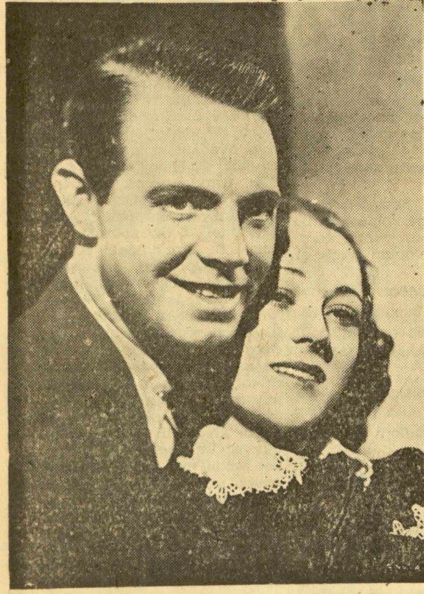
Η Σάλλυ Γόουρντ και ο Τσαρλς Τσαπλίν στην ταινία «Καταδικασμένες γυναίκες».