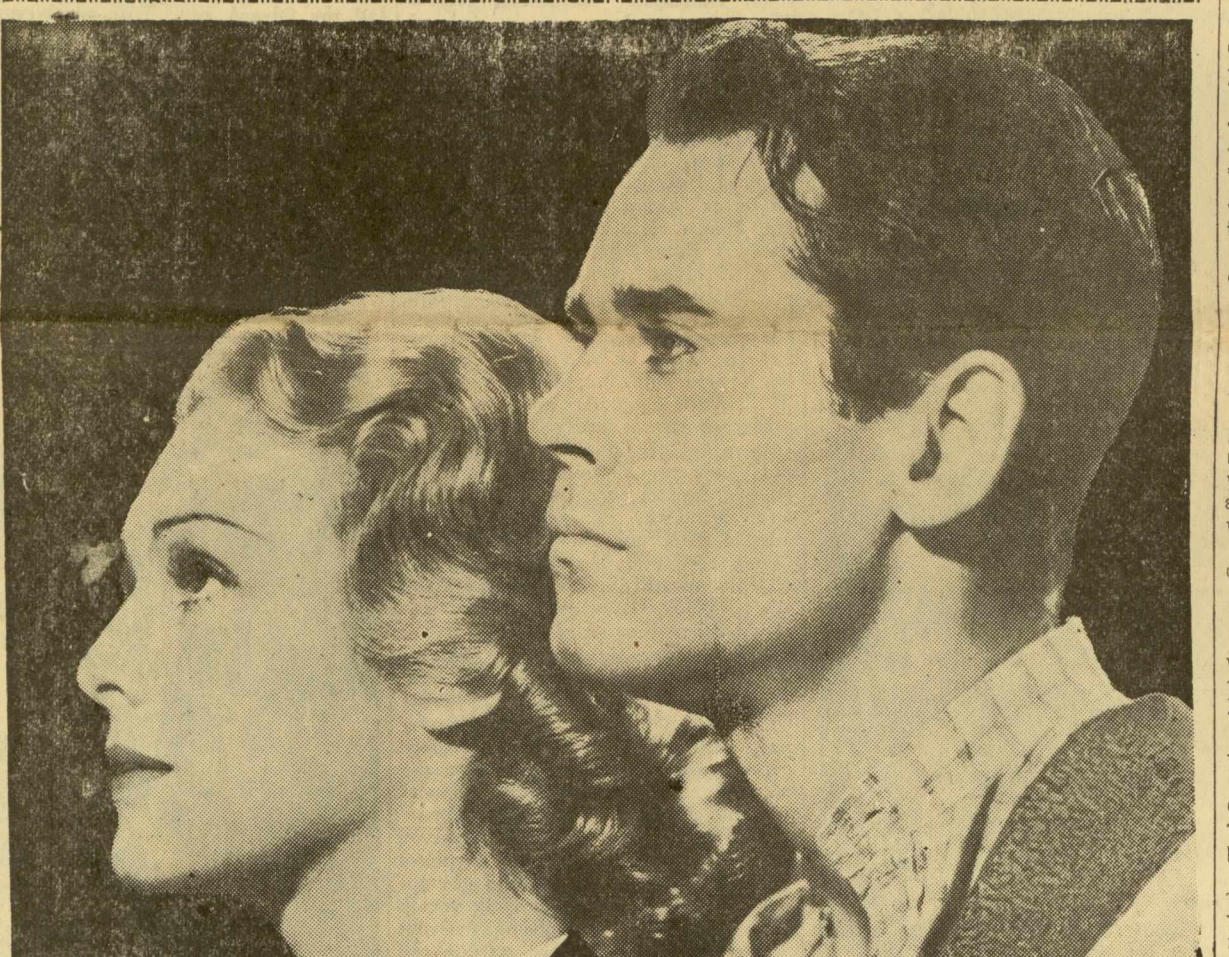
Μαντλέν Κορλέ και Χένρι Φόντα