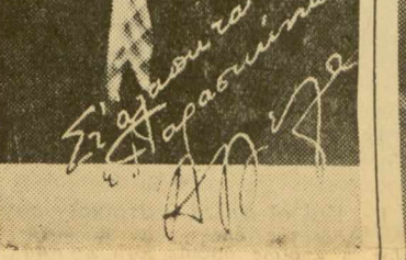
Η 'Αγγέλα Λυκαρινοπούλου