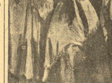
Από τον «Επιθεωρητή» του Γκόρνολ της περιουσιότητας σκηνης της Σαξονίας.

«Ο θιάσος δεν ένδιαφέρωνται για τις εισπράξεις. Έχουν άπασχολημένον «Έλλήνων» κι' άλλοθία: θα μπορούσε να μαντέψη κανείς μέ-