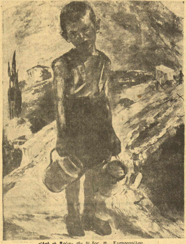
Από τη Βρύση της Σι δος Μ. Σωτηροπούλου