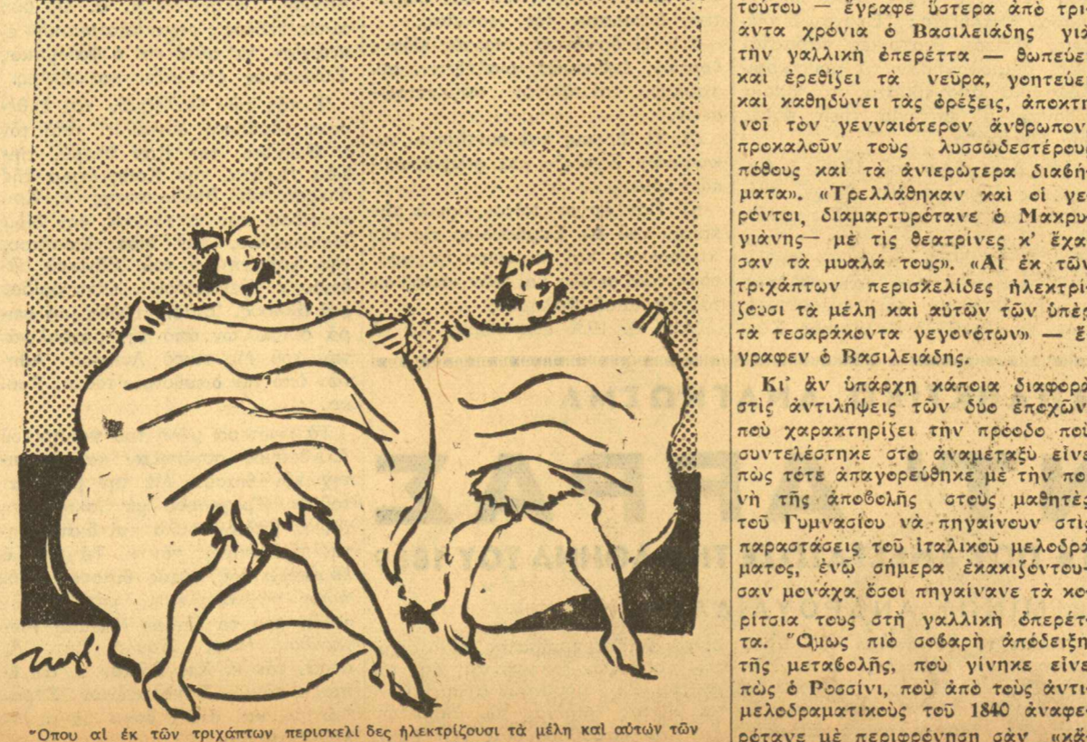
Όπου οι έκ των τριχάτων περισκελίδες ηλεκτρίζουσι τα μέλη και αυτών των υπέρ τα τεσσαράκοντα γεννητόν.