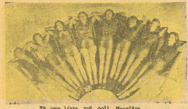
Τό μπαλέτο τού φολι... Μπαιρέας