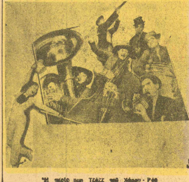
Με περίηγη τής ζωής τού κάμπαρε... Ρόθ