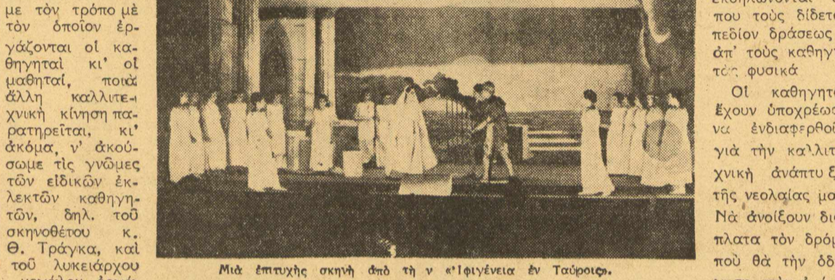
Μία έπισημη σκηνή από τη ν 'Ιφιγένεια εν Ταυροις.