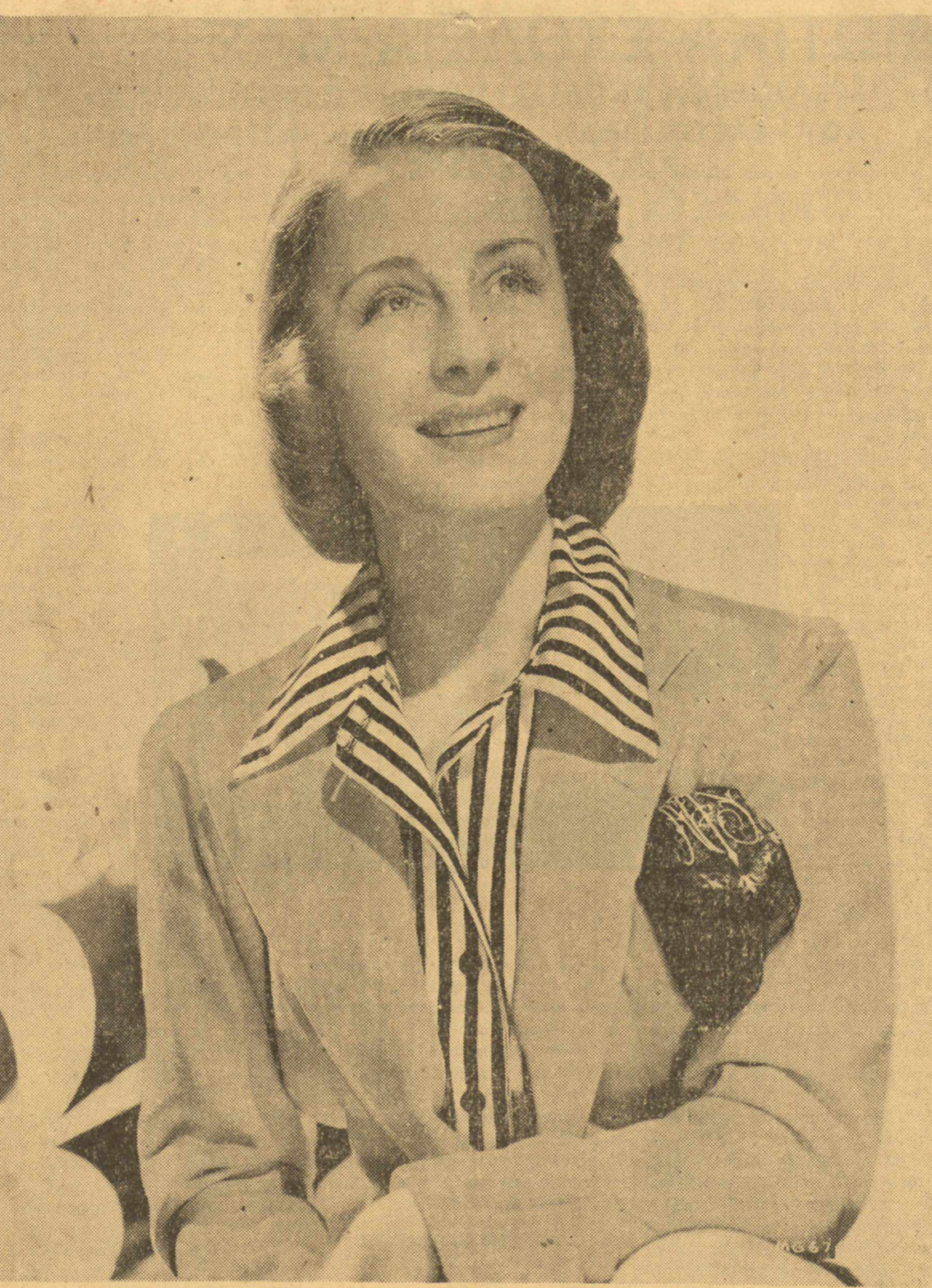
Η άνεπρέλητη καλλιτέχνισ της όθνης ΝΟΡΜΑ ΣΗΡΕΡ, της όποιας η αυγκλονιστική δημιουργία στο μεγάλο φιλμ της "Μέτρο" «ΜΑΡΙΑ ΑΝΤΟΥΑΝΕΤΤΑ» έτιμήθη με το "Ανώτατον Βραβείο Ηθοποιού (Κύπελλον Βόλιπ)" στη φετιμή Κινηματογραφική Έκθεσι της Β.εντίας.

Πολύ χαριτωμένη και τελείως ανεξάρτητη θέλησε να παίζει στον κινηματογράφο, με το ψευδώνυμο Σάντρα Σέου. Πράγματι έπαιξε στην ταινία "Ματωμένο χρίμα" και έσημειωσε μεγάλη έπιτυχία, αλλά παρά την καλή άρχή και την