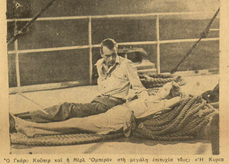
Ο Γκάρι Κούπερ και η Μπέρλ "Όμπερν" στη μεγάλη έπιτυχία τους: "Η Κυρία και ο Κάου-μπός".

το έκπληρωσε μ' έπιτυχία. -Ο Ουίλλιαμς Πάουελ, διακριώνεται να πιστευομε στα άπρόοπτα της ζωής, έχοντας παράδειγμα την τήχη του. Αυτά τα "άπρόοπτα", ίσχυ-