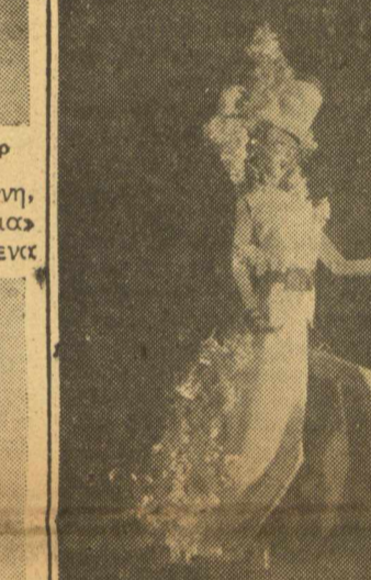
«Από τ'ην «Κυρία Σελήνη» μετ' χορο... τρια, δανουμαϊκά.