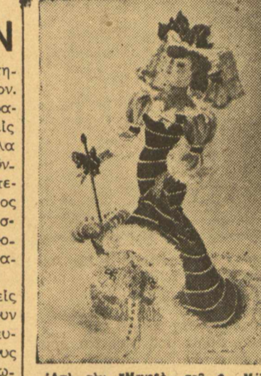
«Από τ'ον Έμενεξ τ'ο Σ. Μόλιερ