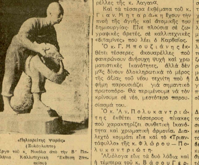
«Φηλορέτης Βορσός» (Σταυρούλιτο). (Έργο του κ. Νικόλα από την Β' Πανελλήνια Καλλιτεχνική Έκθεση στο Ζαππεύσιον).