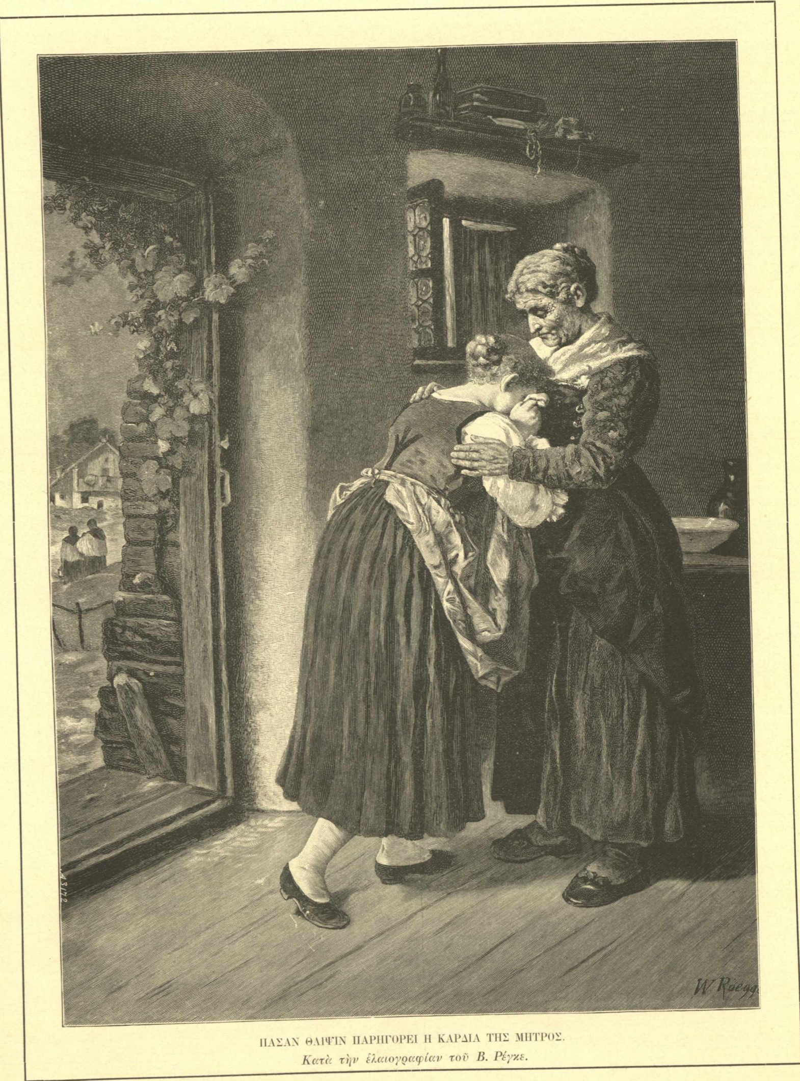
ΠΑΣΑΝ ΘΛΙΨΙΝ ΠΑΡΗΓΟΡΕΙ Η ΚΑΡΔΙΑ ΤΗΣ ΜΗΤΡΟΣ. Κατὰ τὴν ἐλαιογραφίαν τοῦ Β. Ρέγκε.

ναι, τὸ πρῶτον τοῦτο ψεῦδος τῆς προοιδεῖ ἡ συγκίνησις καὶ ἡ ἀμηχανία, εἰς ἣν τὴν ἔριψεν τὸ μικρὸν πταῖσμα, ὑπερ ἐκηλίδωσε τὴν ἄσπλον ἀθωότητά τῆς. Ποῦ ἡ παιδρὰ οἰκειότης μεθ' ἧς τρέχουσα περιέβαλλε τὸν πατρός τῆς τὸν τράχηλον καὶ ἡ παιδικὴ ἀμεριμνησία καὶ ἡ λάλος πολυπραγμοσύνη τῆς; συνεσταλμένη καὶ περιδεής, τεθλιμμένη καὶ μετανοοῦσα ἤδη ἐνδομύχως, δὲν τολμᾷ νὰ ἐδείρῃ τοὺς ὀφθαλμοὺς καὶ προσβλέψῃ τὸν πατέρα, ἐπὶ τῆς μορφῆς τοῦ ὁποῖου ὁ εὐφάνταστος τεχνίτης ἐπιτυχῶς ἐξεικονίζει τὴν αὐστηρὰν ἀλλὰ καὶ φιλάγαθον μέριμναν, ὅπως ἐξακριβώσῃ πρῶτον τὸ κακὸν καὶ ἐπιχειρήσῃ εἶτα διὰ τῶν πατρικῶν του παρακλήσεων τὴν καταπολέμησιν αὐτοῦ, ἅμα τῇ πρώτῃ ἐκδηλώσει. Πτωχὸς ἀλιεὺς,