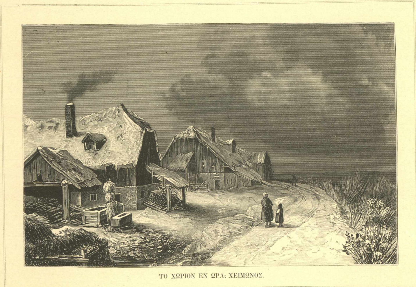
ΤΟ ΧΩΡΙΟΝ ΕΝ ΩΡΑ· ΧΕΙΜΩΝΟΣ.

Τώρα ἡ συγκίνησις κορυφούται ὡς εἰς τὴν τελευταίαν πρᾶξιν δράματος· ὀλίγα στιγμὰ ὑπολείπονται, ἐπληρίσασαν, ἀνωθοῦνται· ὄλοι ἐκτείνουσι τὸν βραχίονά των διὰ ν' ἀρπάσωσι τὸ ἱερὸν ἔμβλημα· ἡ θέλησις ἔσχατον καταβάλλουσα ἀγῶνα περνίξει ἰσχυρῶς τὰ κωμικῶτα μέλη.