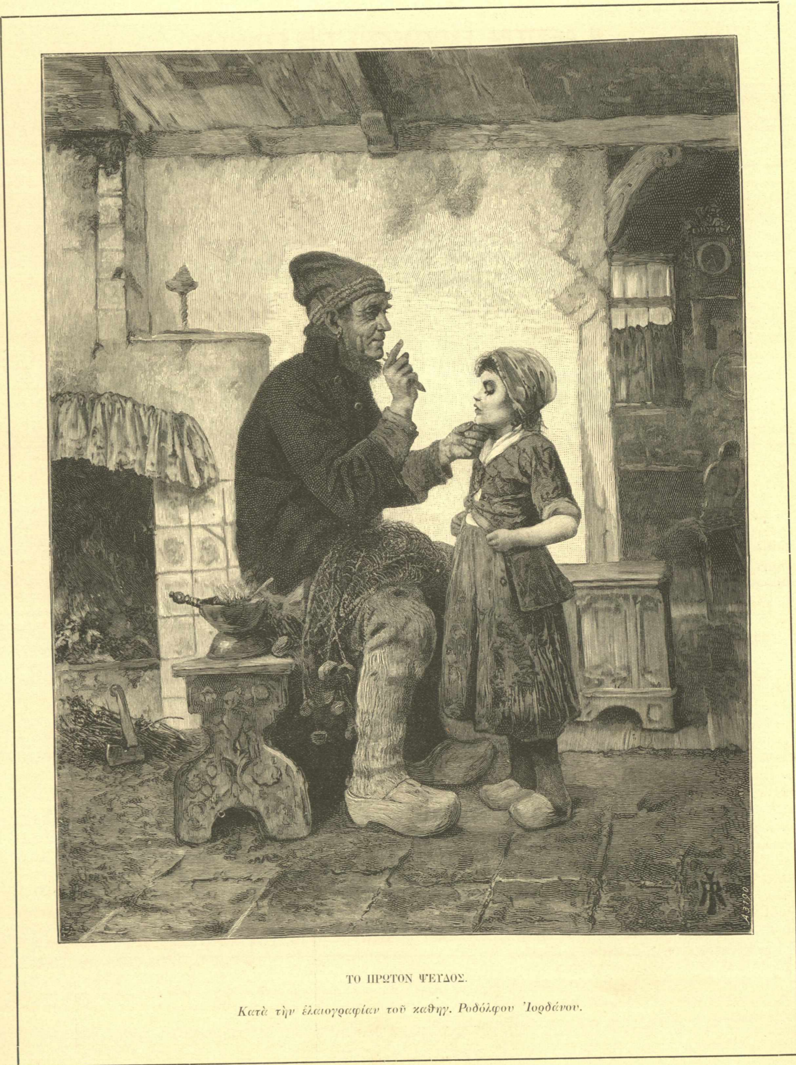
ΤΟ ΠΡΩΤΟΝ ΨΕΓΓΑΟΣ.

Κατὰ τὴν εἰκονογραφίαν τοῦ καθηγ. Ροδόλφου Ἰορδάνου.