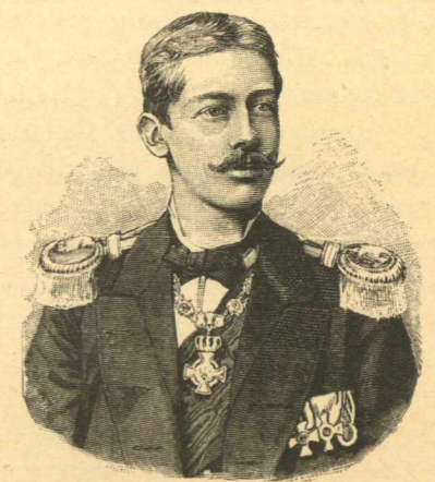
Ο ΠΡΙΓΚΗΨ ΤΗΣ ΠΡΩΣΙΑΣ ΕΡΡΙΚΟΣ.