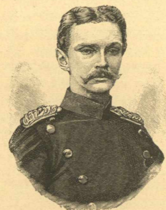
Ο ΠΡΙΓΚΗΨ ΔΙΑΔΟΧΟΣ ΤΟΥ ΣΛΕΘΝΙΚΟΥ ΜΑΪΝΙΓΓΕΝ ΒΕΡΝΑΡΔΟΣ.