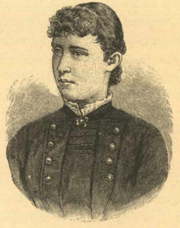
Ἡ ΠΡΙΓΚΗΠΙΣΣΑ ΕΙΡΗΝΑΙΑ ΕΡΡΙΚΟΥ ΤΗΣ ΠΡΩΣΙΑΣ.