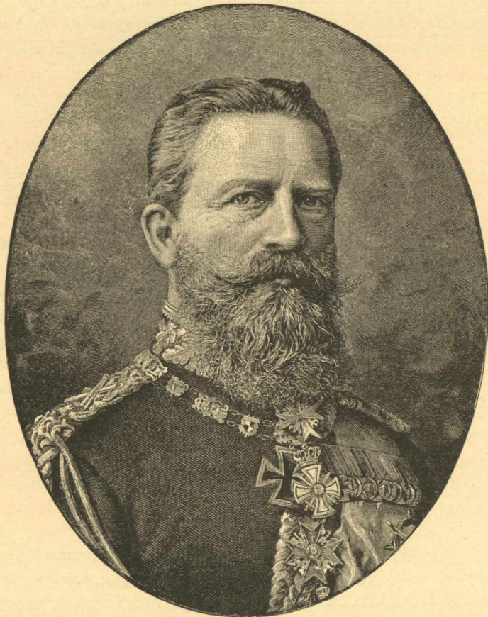
ΑΥΤΟΚΡΑΤΩΡ ΦΡΕΙΔΕΡΙΚΟΣ Γ΄.

Τοιαύτη ἦν ἡ προηγηθεῖσα τῆς ἀναρρήσεως τοῦ Χριστιανισμοῦ ἀστασία, ἀνωμαλία καὶ διαφθορά, ὡς καὶ ἡ διαδεχθεῖσα καὶ συνοδύσασα τοῦτον βύθμις· δι' ὃ συνεπὲς ἦν ἅμα τῇ ἀναρρήσει αὐτοῦ νὰ μελετήσῃ πρὸς ἀνάπλασιν ἰδίου τύπου ναοῦ, δι' οὗ, ἀποξενούμενος πλέον τῶν μέχρι τότε ἐν χρήσει, νὰ δύναται ἐν τῇ νέᾳ τοῦ τύπου μορφῇ νὰ συνάδῃ πρὸς τὰς θεμελιώδεις αὐτοῦ διατάξεις καὶ νὰ φέρῃ στοιχεῖα, δι' ὧν νὰ εἰκονίζῃ μὲν τοὺς τόπους τῆς προσελύσεως, ἐμφράινῃ δὲ τὴν ἱστορικὴν αὐτοῦ καταγωγὴν. Τούτων ἕνεκεν, εἰ καὶ ἐν τῷ τύπῳ τῶν χριστιανικῶν ναῶν ὡς ἀρχικὸν διάγραμμα τὸ τῶν βασιλικῶν ἐφηρμόσθη, ἐν τούτοις ἐν τῇ μετὰ ταῦτα διαρρυθμίσαι καὶ τῇ ἐκ θεμελίων ἰδρῦσαι δύο κύρια βάσεις ἐτέθησαν· ἐπὶ δὲ τῶν βάσεων τούτων ἐκανονίσθη τὸ πρῶτον αὐτῶν διάγραμμα. Αὗται δ' αἱ βάσεις ἐγένοντο, ἀφ' ἑνὸς μὲν ἢ ἐν Ἀνατολῇ τέχνη σφόδρα μεταποιηθεῖσα καὶ, οὕτως εἰπεῖν, τελείως ἀναμορφωθεῖσα παρὰ τῆς ἑλληνικῆς, ἥτις μετηνέγχεθη ἐκεῖ διὰ τοῦ ἐν Ἀλεξανδρείᾳ φωταναγάζοντος πανταχόσε κατὰ τὴν ἐποχὴν ἐκείνην πολιτισμοῦ, τοῦ περικλείοντος πᾶσαν ἐπιστήμην καὶ τέχνην· ἀφ' ἑτέρου δὲ ἢ τοῦ ἰουδαϊσμοῦ ἱστορία, πρὸς