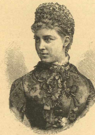
Ἡ ΠΡΙΓΚΗΠΙΣΣΑ ΚΑΡΛΟΤΤΑ ΒΕΡΝΑΡΔΟΥ ΤΟΥ ΣΛΕΘΝΙΚΟΥ- ΜΑΪΝΙΓΓΕΝ.