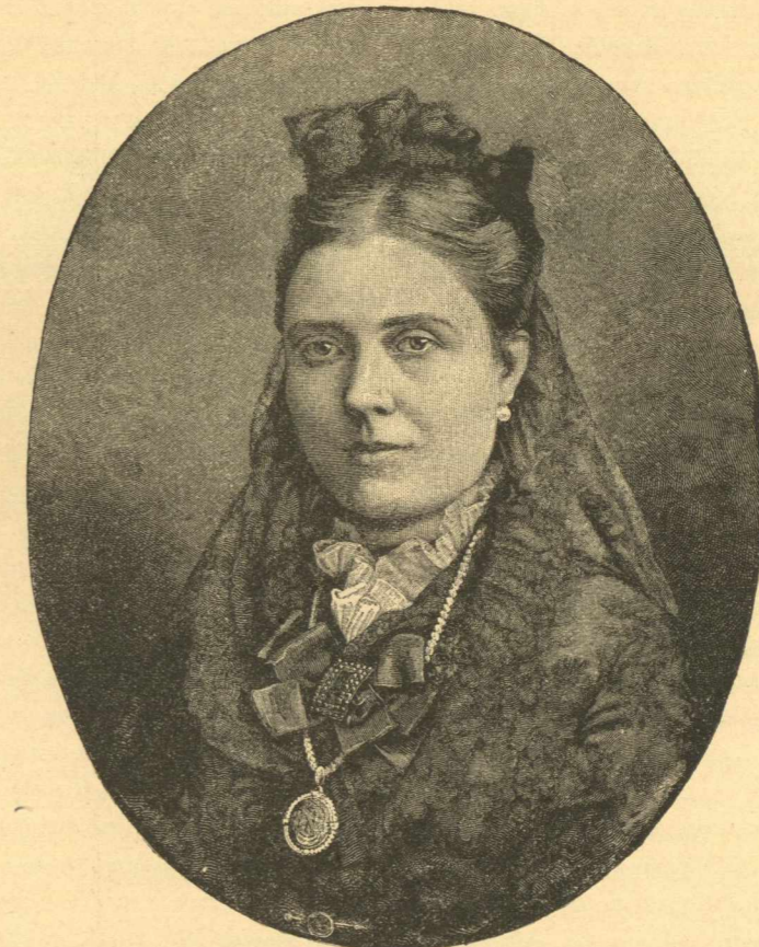
Ἡ ΑΥΤΟΚΡΑΤΕΙΡΑ ΦΡΕΙΔΕΡΙΚΟΥ ΒΙΚΤΟΡΙΑ