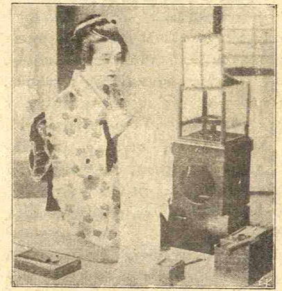
Ἰαπωνίς καλλιτέχνης ποικίλουσα διὰ τοῦ χρωσπῆρος καταπέτασμα.

ραϊότητά της μορφῆς της ἣτις ἐφαίνετο ἀπ' ἐνεντίας προσλαμβάνουσα νέαν λάμψιν, γινόμενη ἐτι γλυκεῖα.