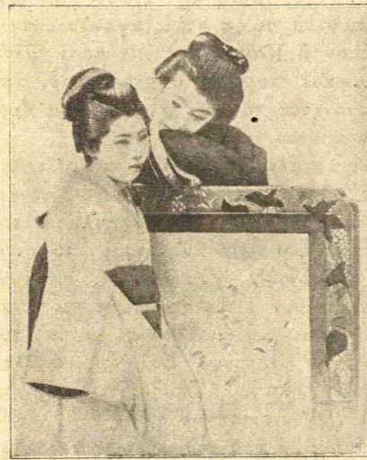
Δεσποινίδες Ἰαπωνίδες καλῆς τάξεως