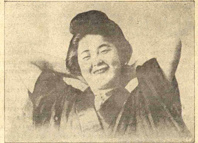
Ἰαπωνίς (Μουσὴ τῶν τεύσιπολεσιῶν)