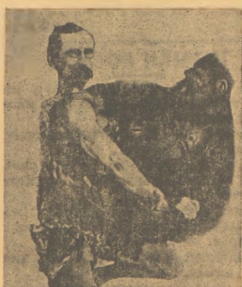
Ἐνα ἐρωτησμένο ζευγαράκι ἀπ' αὐτὰ πού σταναντῶνται συχνὰ εἰς τὰς ἀθηναϊκὰς ζούγκλας.