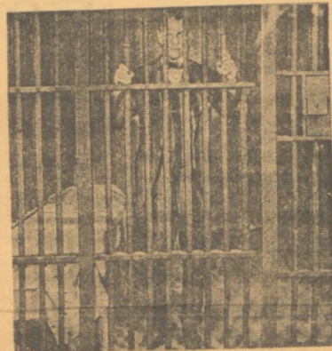
Πῶς ἐκδικούμενος νὰ μεταφερῶσιν τὰ γραφεῖα τῆς «Παπαρούνας»...

—μοῦ εἶπε γιὰ ἐπιχείρημα ὁ φίλος τελευταῖο — πῶς ἄρισες καὶ γίνηκε τὸ φοβερὸ τὸ κάζο; —Μπάς καὶ θαρρεῖς, τοῦ ἀπάντησα, μωρὲ πῶς σὲ διαβάζω; —Τότε, μοῦπε κι' ὁ Κόκκορας, τὸν ἑαυτὸ σου πιάσε, γιὰ ὄ,τι πάθεις τὸν Πῶλ Νὴρ μονάχα νὰ αἰτιάσαι. Ἐανὰ τοῦ εἶπα: «Κόκκορα ἀγαπητέ, γιὰ πῆς μου, στῆς «Παπαρούνας» στρέφοντας τὸν ἄλλον Καππαδόκη, σ' ἔλα μου τὰ γραφόμενα βρήκες τίποτα σῆκιν; Κι' αὐτῆς μήπως σὲ διάβασα, μ' ἀπάντησε, ποτέ μου; Ἄμέσως ἐκδικούμενος τὴν πρώτη μου κινήματα, γιὰτί εἶνε πάντοτε ὑπερ-