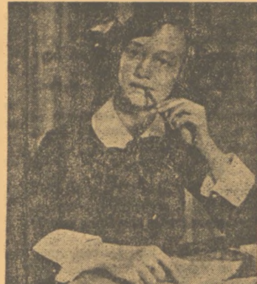
Μια ἀπὸ τὰς συμπαιθεῖς συνεργατίδας μας, ἡ ἀποία ἐπιθυμεῖ νὰ δημοσιεύσῃ εἰς τὸ φύλλον μας τὰ μικρὰ τῆς μυστικῆς. Ἰδέτε μὲ πόσην χάριν σαλιᾶνει τὸ μολύβι τῆς!...