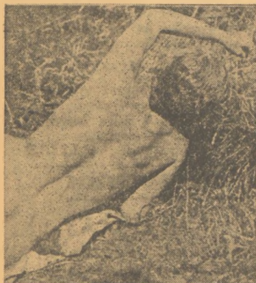
Ὅπως ἐξηγήθηκαμε καὶ εἰς τὰ ἄλλα μας φύλλα ἐν... πλάτῃ ἡ «Παπαρούνα» δὲν δημοσιεύει γινιά, παρὰ ἰόνων μᾶχους ἐνός σημείου, ἀφίνει δὲ τὴν συμπλήρωσιν εἰς τὴν φαντασίαν τῶν ποτηρῶν ἀναγνωστῶν τῆς. (Ἰ. Ἰδε συνέχειαν διασθεν)