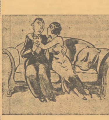
Ἐκεῖνος.— Αὐτοπρονοῦμε σήμερα, ἀγάπη μου; Ἐκεῖνη.— Ἄ, ὄχι σήμερα... Ἐκεῖνος.— Γιατί;!! Ἐκεῖνη.— Γιατί σήμερα βγαίνει ἡ «Παπαρούνα»!