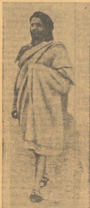
Ὡς μάρτυς τῆς ὑπερσομίας κληροῦν ἦλθε στὴ δόξα τῆς «Παπαρούνας» καὶ ὁ Ἀριστοφάνης...

Είπε αλήθεια έξοχα να ζῆς μὲς στὴν Ἑλλάδα, πού ἔλα τὰ πάντα ἔχουσε μὰ τέτοιαν ἡμορφάδα, θάλασσα, γῆ καὶ οὐρανός, πού λάμπει γύρω φωτεινός κι' ὄλος ὁ χρόνος τῆς περᾶ μ' ἀτέλειωτη λιανάδα! Ἰὴ, μήτηρ παλαιῶν θεῶν καὶ νέων ἡμιθέων γῆ τῶν ἀρχαίων τῶν κλεῶν καὶ τῶν κλεῶν τῶν νέων, γῆ πού δοξάζαν ἥρωες πολλοὶ τε καὶ μεγάλοι, πού ἔπου γύρω κι' ἄν στραφῆς κι' ἀπὸ ἑνας ξεπροβάλλει!