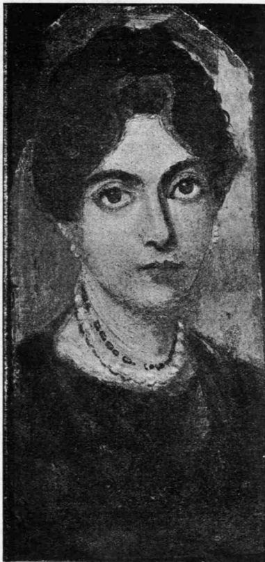
Εἰκόνα ἀπὸ τὸ περιοδικὸ Liebhaber-Künste. P. Ὀλδεμβούργος ἐγδότης. Μόναχο, ἀριθ. 45 τοῦ καταλόγου τῆς συλλογῆς.

κανεὶς φτάνει μόνον νὰ κοιτάξῃ ἓνα ἀπὸ τὰ σχεδιογράφηματα ποῦ συνοδεῖουν τοῦτο τὸ ἄρθρο. Οἱ Αἰγύπτιοι δὲν ἔδωσαν ποτὲ ζωὴ στὲς ζωγραφιῆς του, καὶ ἡ ζωγραφικὴ τους, ἂν καὶ θαυμαστὴ γιὰ τὴ ζωηρότητα τῶν χρωμάτων καὶ διδαχτικώτατη γιὰ ἑμᾶς, εἶνε γιομάτη συμβολικοὺς τρόπους ποῦ ἀπομακραίνουν τὴν παράστασιν ἀπὸ τὴν πραγματικότητα.