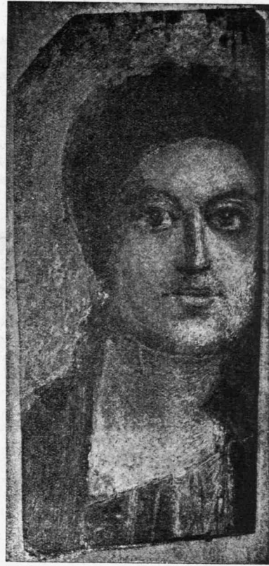
Εἰκόνα ἀπὸ τὸ περιοδικὸ Liebhaber-Künste. P. Ὀλδεμβούργος ἐγδότης. Μόναχο, ἀριθ. 62 τοῦ καταλόγου τῆς συλλογῆς.

τικὰ προσωπογραφίαι ἐθνικῶν καὶ ὄχι χριστιανῶν, λέγει ὁ Ebers, οἱ ἀρχαιότερες ἀνεβαίνουν στὸν τρίτον αἰῶνα πρὶν Χ. οἱ νεώτερες εἶνε τῆς ἐποχῆς τοῦ Ἀδριανοῦ. Οἱ παλαιότερες εἶνε οἱ καλῆτες τῆς συλλογῆς. Εἶνε ζήτημα ἂν τὰ ὑποκείμενα ποῦ παρασταίνου ἐξωγραφθῆκαν ζωντανὰ ἢ πεθαμένα, καὶ οἱ δύο ὑποθέσεις μπορεῖ νὰ ἀληθεύουν, ἄλλες δηλαδὴ εἰκόνες νὰ εἶνε