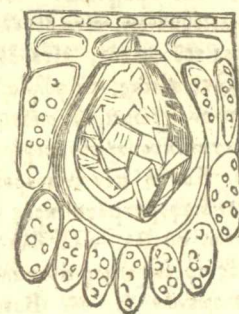
Μέρος κυτταρώδους ἴστοῦ ἐκ τῆς κατὰ πάχος τομῆς τοῦ φύλλου τῆς κοινῆς καρύας ( Juglans Regia ) ἐν τῷ μέσῳ τοῦ ὁποίου φαίνεται μέγα κύτταρον φέρον ἐπὶ ποδίσκου κρυστάλλα συσσωρευμένα.

Τὰ κρυστάλλα ταῦτα εἶναι, εἴτε μεμονωμένα, εἴτε συσσωρευμένα ἔχουσι σχῆμα ῥομβοῖδρων, κύβων ὀκταέδρων, ἢ πρισματῶν διαφοροτρόπως καταληγόντων. Εἰς τὰ φύλλα τῆς κοινῆς καρύας ( Juglans Regia ) εὐρίσκονται συσσωρευμένα ἐπὶ ποδίσκου ὅστις φεταῖ ἀπὸ τὴν κορυφὴν κυττάρου ἰδιαίτερας καὶ μεγαλητέρας κατασκευῆς.