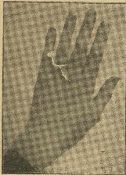
ΤΟ ΔΑΚΤΥΛΙΔΙ ΤΟΥ ΔΙΑΖΥΓΙΟΥ

“ Ἡ ἀνωτέρα εἰκὼν μᾶς παρουσιάζει τὴν βασίλισσαν τῆς κάλλου τῆς τοῦ Ὀνολοῦλου.