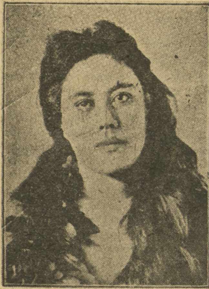
Η ΨΡΑΙΑ ΤΟΥ ΟΝΟΛΟΥΛΟΥ