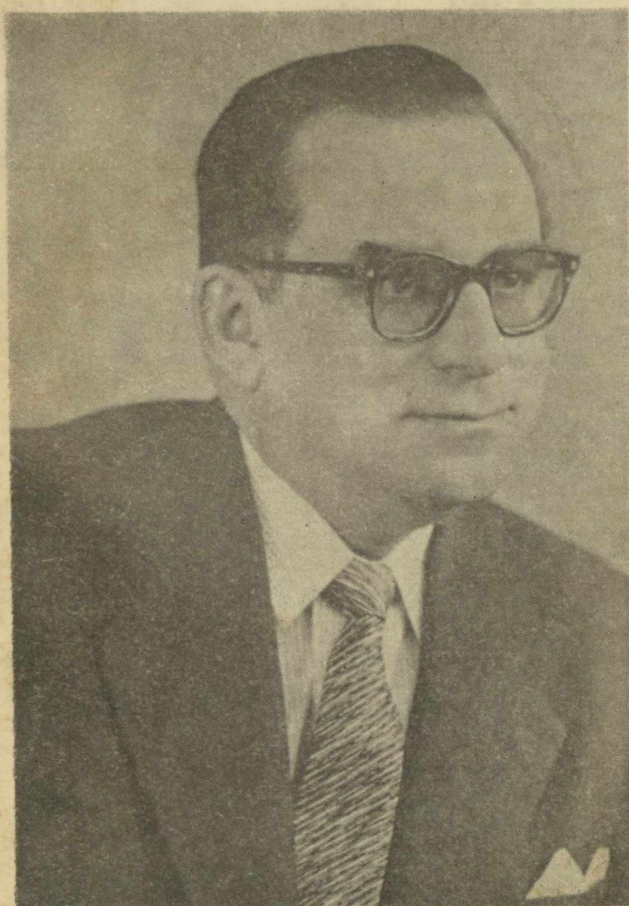
ΓΡΗΓΟΡΙΟΣ ΚΑΣΙΜΑΤΗΣ Υπουργός Έθν. Παιδείας και Θρησκευμάτων