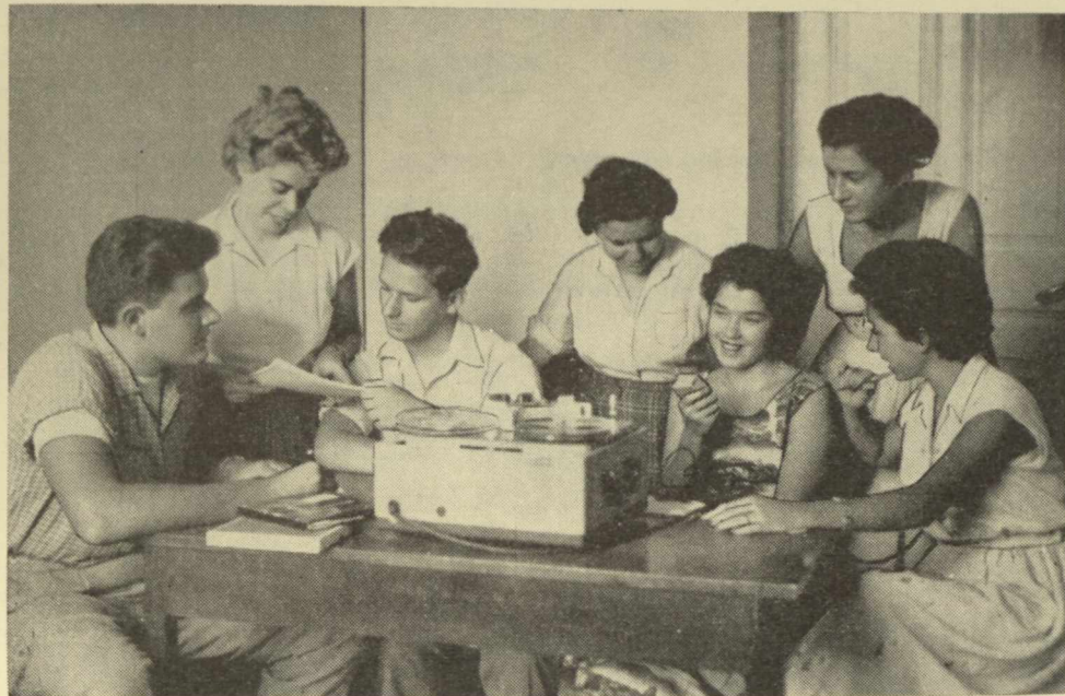
Εἰς τὸ Lehman Language Laboratory τοῦ Πανεπιστημίου Columbia χρησιμοποιοῦνται εὐρέως αἱ μηχαναὶ εἰς τὴν ἐκμάθησιν τῶν ξένων γλωσσῶν.

Ἡ χρῆσις βοηθητικῶν μηχανημάτων γενικεύεται ἡμετέροις καὶ εἰς τὴν Ἑλλάδα. Ἄνωτέρω, ὁμάς σπουδαστῶν τοῦ Ἰνστιτούτου Ἀμερικανικῶν Σπουδῶν- IAS, τελειοποιουμένη εἰς τὴν ἐκμάθησιν τῆς ὀρθῆς προφορᾶς ἀγγλικῆς γλώσσης τῆ βοηθεῖα μηχανητοφώνου. Ἡ ἀσκήσις περιλαμβάνει τρία μέρη :