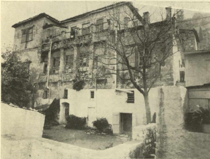
ΤΟ ΠΡΩΤΟΝ ΟΙΚΗΜΑ ΤΟΥ ΠΑΝΕΠΙΣΤΗΜΙΟΥ ΕΙΣ ΠΛΑΚΑ

A MONTHLY REVIEW Published with the cooperation of the INSTITUTE OF AMERICAN STUDIES - I.A.S. ATHENS