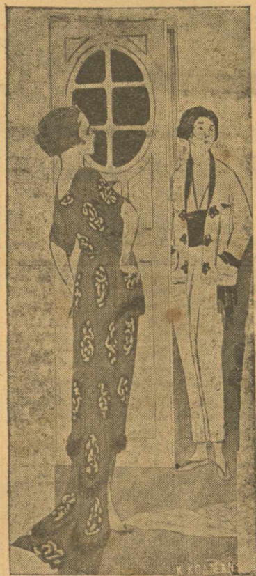
Πυζαμάς καὶ ρόμπι