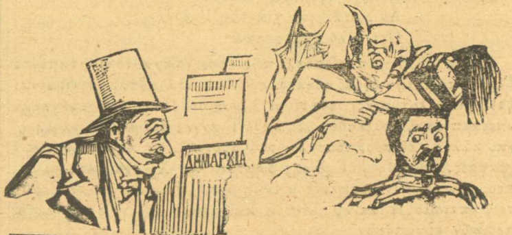
Ὁ Νταλέκος μελετᾷ πὼς θὰ διοικήσῃ τὴν Δημορχία;

Ἄν καλὰ ποῦ μὰς ἀφίνουν τὰ σημωνιακὰ νὰ σκεφθοῦμε καὶ περὶ ἐκκλησιῖς καὶ κερῶν. Αἱ μωρὲ, ποῦ κατάντησίμοι.