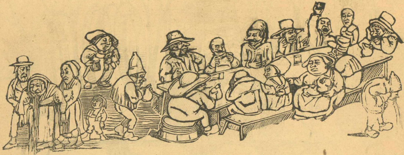
Τὸ πνευγύρι τῆς Καίσαρμανίας.

φόρα ὁ Λαός, διότι δὲν κατάλαβε ἀλόμα τὴν σκληρότητος τῶν νόμων σου, γιατί δὲν ἐφαρμόστηκαν ἀκόμη.