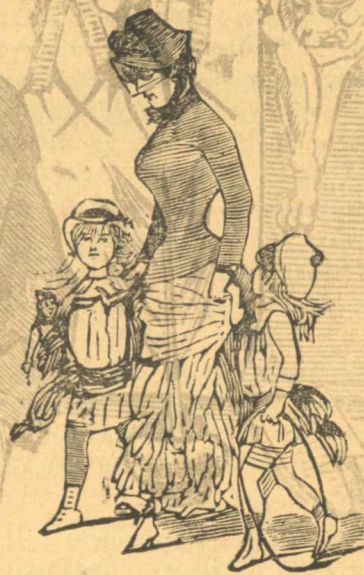
Ἡ κυρία μαρτὰμ πάει στὸ θέατρο νὰ γανορίσῃ τὰ παιδιὰ της καὶ νὰ δώσῃ καὶ λίγο πλειρίτη.

Βρὲ κύριοι τοῦ ἀπομαχικοῦ ταμεῖου, δὲν σᾶς φτάνουν ὅσα κολλοῦν στὰ χεῖρα σας, μόνο θέλετε νὰ καταπῆτε καὶ τὸ ἀπὸ 9 ψωροδραχμαῖς φυλλάδιο τῆς φτωχῆς; Τῆ κατάρρα της νάχεταί, θευήλαται.