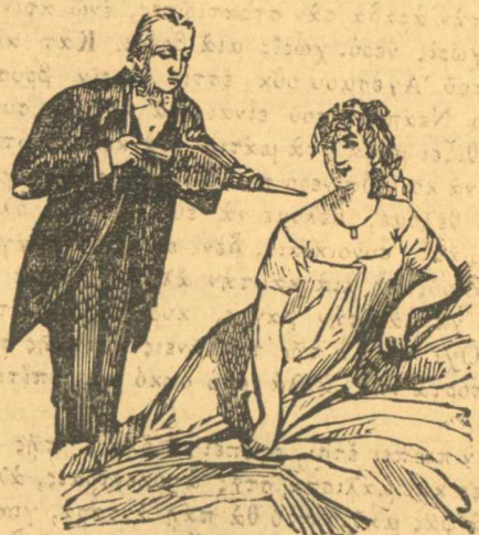
Νέο εἶδος βεκτάγιας γιὰ δροσίωμα τῶν κυριῶν, διατ' ἐυπρόσθ' πρὸ πρωῦ.

Ἀλλὰ αὐτὴ σὴ νέα συνήθεια ὁ διευθυντῆς τὴν ἔβανε σὲ ἐνέργεια ὄχι γιὰ κακὸ σκοπὸ, ἀλλὰ γιὰ καλὸ, διότι δίνοντας μπάτσους στῆς γυναῖκες δοκιμάζει καὶ κατὰ πόσο εἶναι μαλακὰ καὶ τρυφερὰ τὰ μάγουλά τους. Πιῦ στὸ διάβολο τοῦ κατεβαίνουν αὐταῖς ἢ ιδέαις εἶναι νὰ θαυμάζῃ τινὰς. Τῆ δουλιά σου, Κισονάκε, καὶ λίγο λίγο θὰ καταντήσῃς νὰ τῆς βρέξῃς καὶ τοῦ Τρικούπη.