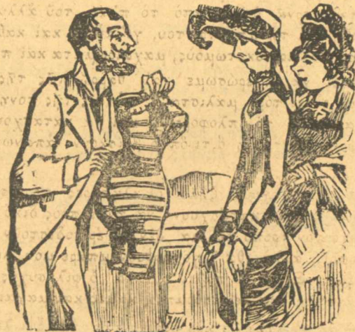
Κυρία, αὐτὸς ὁ νέος κισὸς ἔχει τὴν ιδιότητα νὰ κἀν τῆς λιγναῖς παχαῖς.