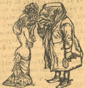
Ὁ πατέρας συμβουλεύει τὸ Νταϊδάκι του.