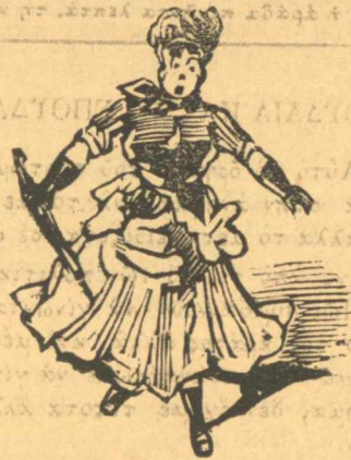
Ἔπος τραγουδίστρας τοῦ καγὲ σατάν.

Πρὸς τοὺς ἐντίμους ἀνταποκριταῖς μου Πατρῶν, Σμύρνης, καὶ Χαλκίδος. Ἐλαβα τὰ χρήματα καὶ σᾶς εὐχαριστῶ διὰ τὴν ἀκριβῆ ἀκριβείᾳ σας.