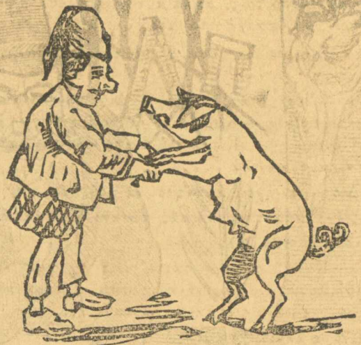
'Αγαπητέ μου φίλε, ποῦ θὰ ρίξῃς τὸν ψιφὸ σου.