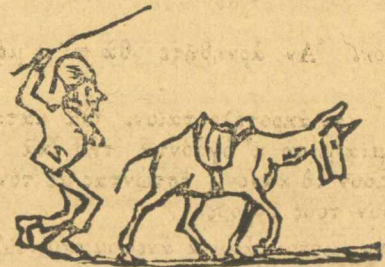
Τὸν πάει νὰ ψηροφορήσῃ.