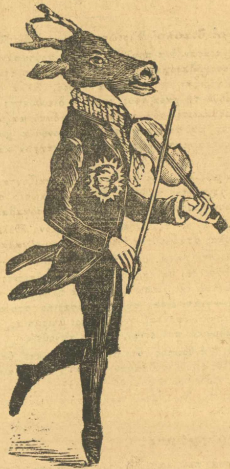
Ο χρυσογάδαρος που ήτανε στο κάρρε.