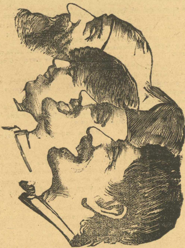
Οί λουδοτροί και οί ξυπόλυτοι γελούν τούς χρυσογαδάρους. — Αϊ, δέν γελούν ;