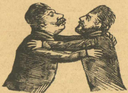
Οί λουδοτροί και ξυπόλυτοι φιλοφρονται.