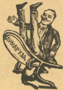
Αμ τουτος πάλι ποιός νάναι που την έπαθε ; Σάν Περαιώτης φαίνεται.