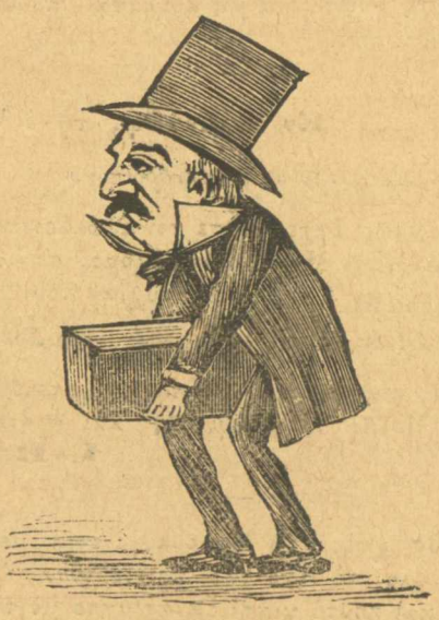
Πάει στὸ παλάτι νὰ τοῦ ὑπογράψουν ρουσφέτια.

Σῶπα, βούλωσε τὸ βρωμερὸ στόμα σου, ἀναιδέστατε ψεύτη. Γούτς!