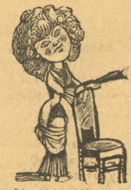
Τὸ Νααῖδάκι (ἡ συντήρεια μεταίτριον).